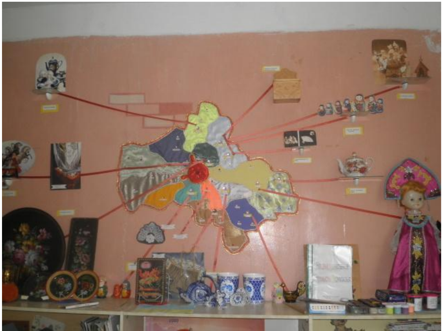
Ознакомление детей с историей развития народных промыслов Московской области