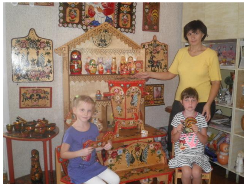
Знакомство детей с городецкой росписью