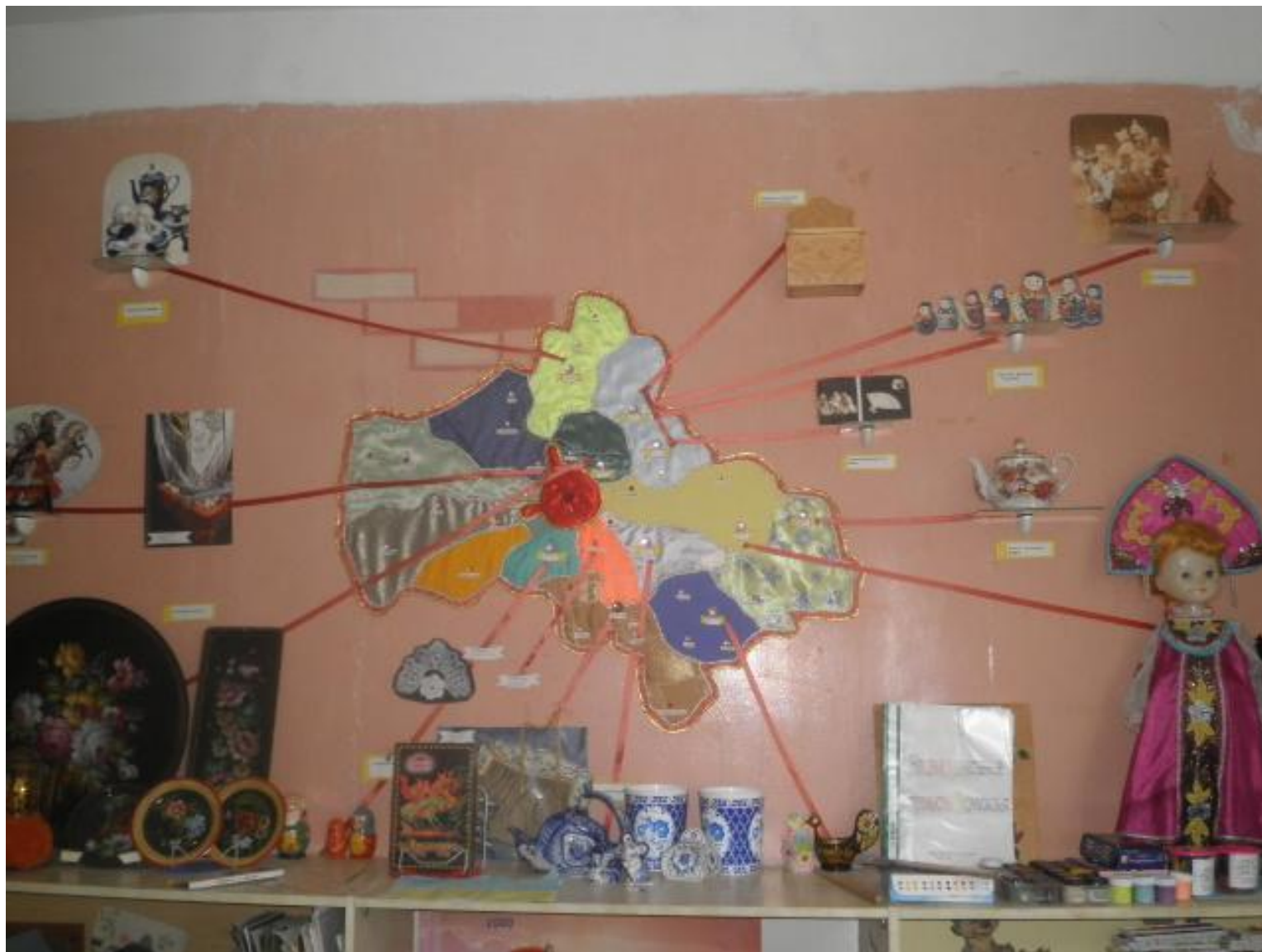
Ознакомление детей с историей развития народных промыслов Московской области