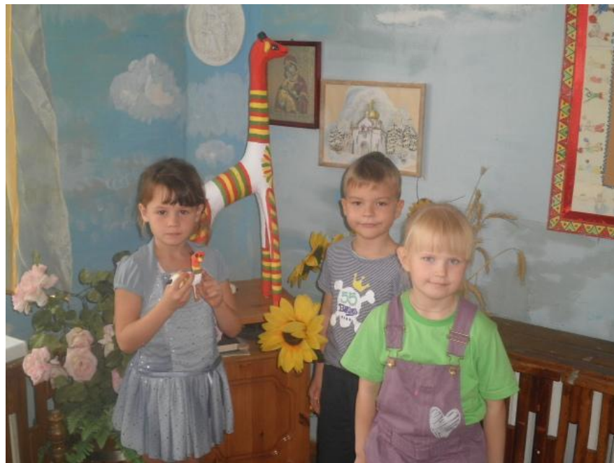
Рассматриваем филимоновской игрушки «Конь»