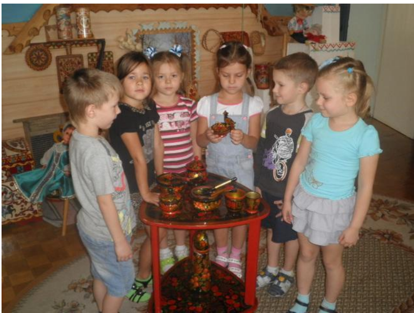
Знакомство детей с хохломой