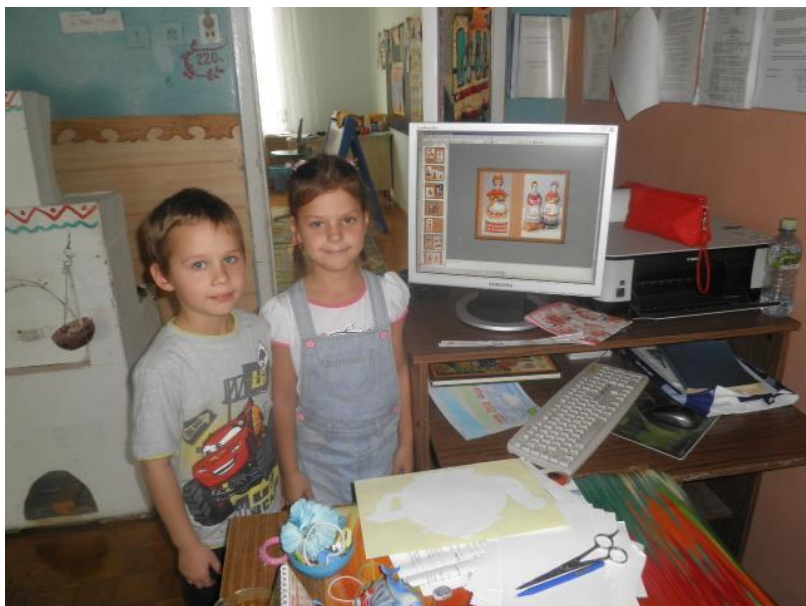
Презентация «Дымковская игрушка»