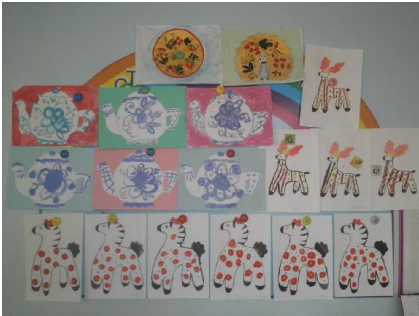
Выставка рисунков детей группы №9 «Радуга»