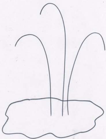
Рисуем проталинку и стебельки