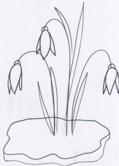
Рисуем узкие пёрышки листьев