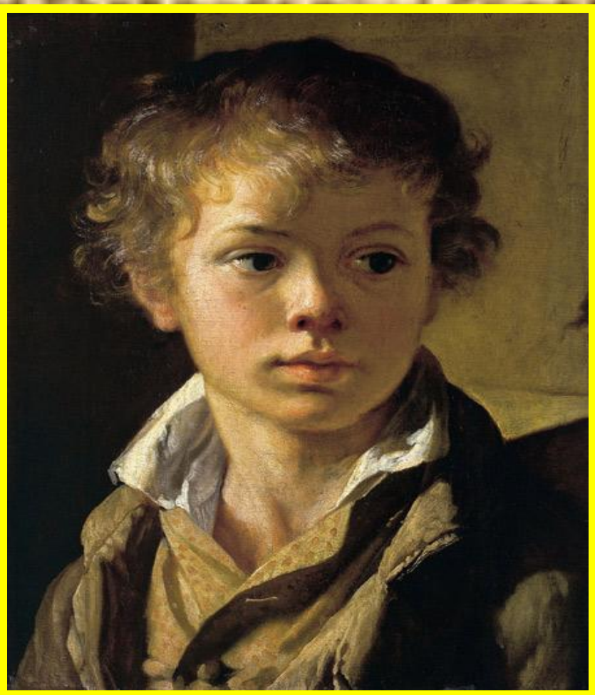
В.Тропинин Портрет сына художника