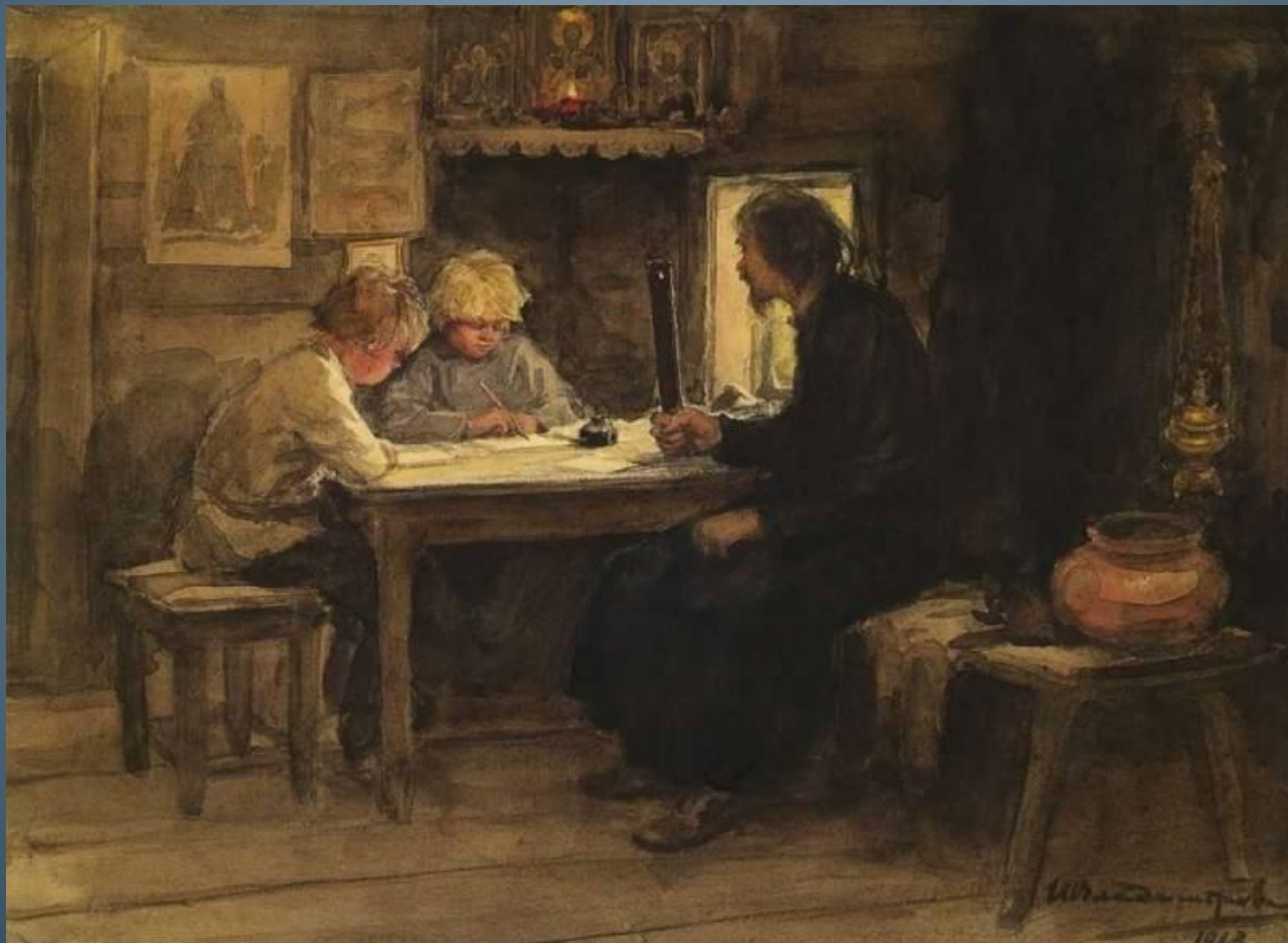
И. Владимиров «На уроке грамоты у дядька»

Как вы думаете, о чём думает каждый из персонажей сюжета?