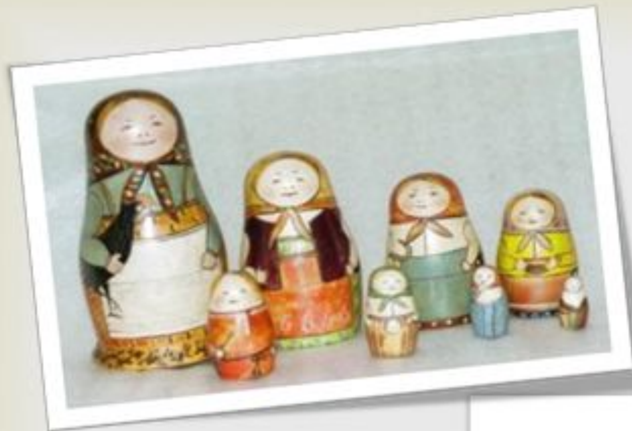
Первая русская матрёшка