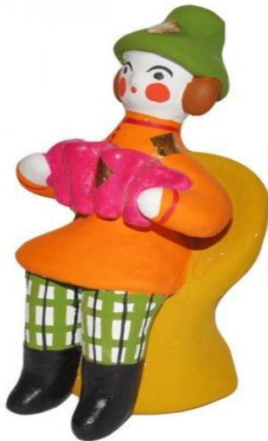
Ряженый с гармошкой