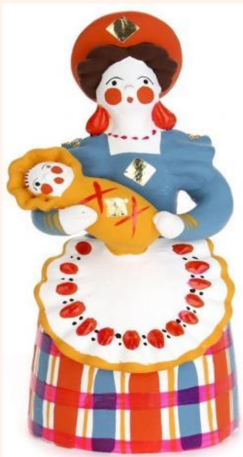
В кокошнике няня, На руках Ваня