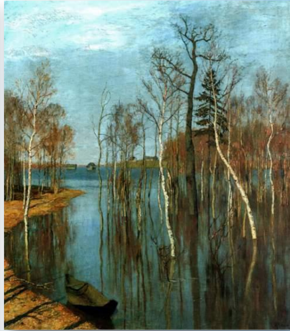
Исаак Левитан «Весна. Большая вода»