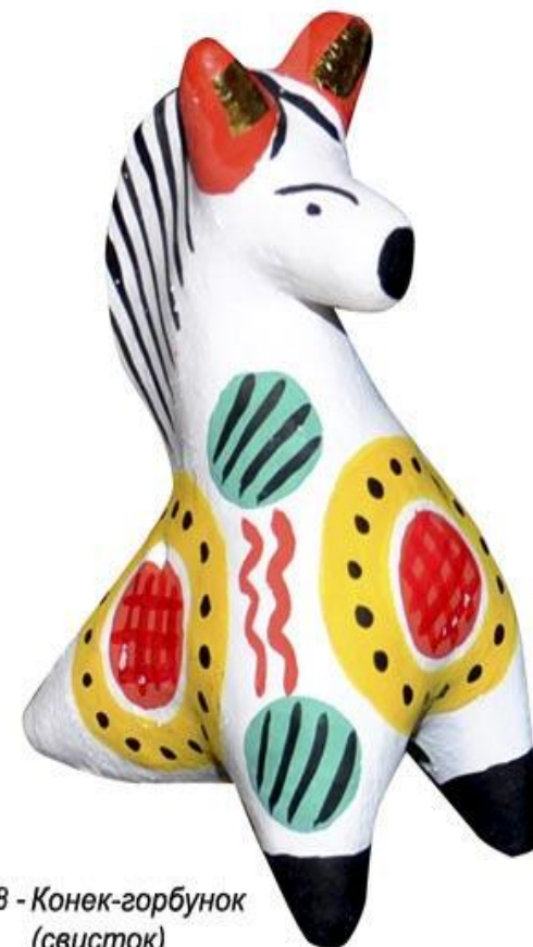
08 - Конек-горбунок (свисток)