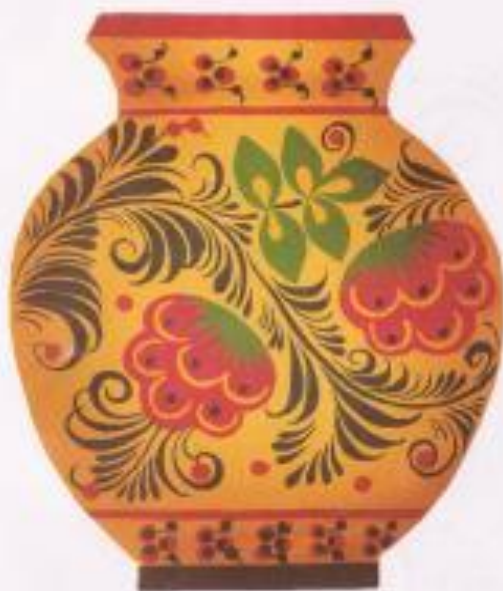
ВАЗОЧКА ДЛЯ ЦВЕТОВ