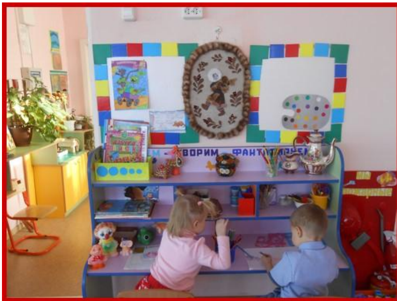
Самостоятельная деятельность детей.