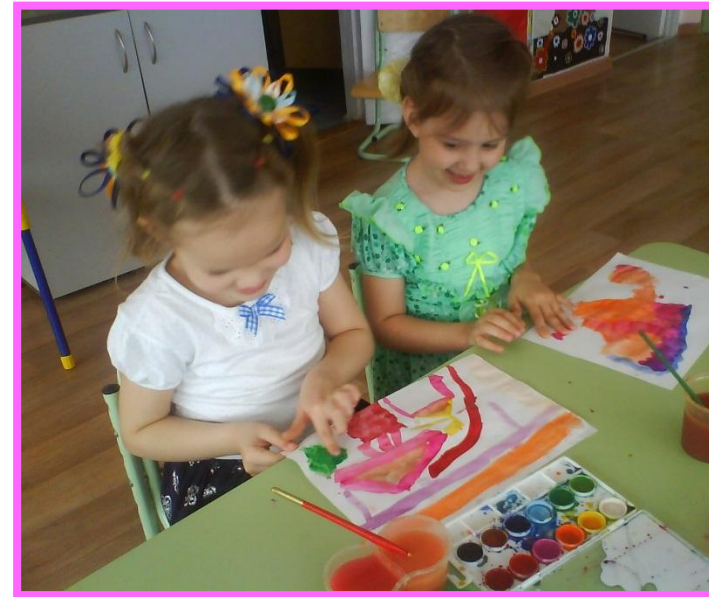
Совместная деятельность воспитателя с детьми.