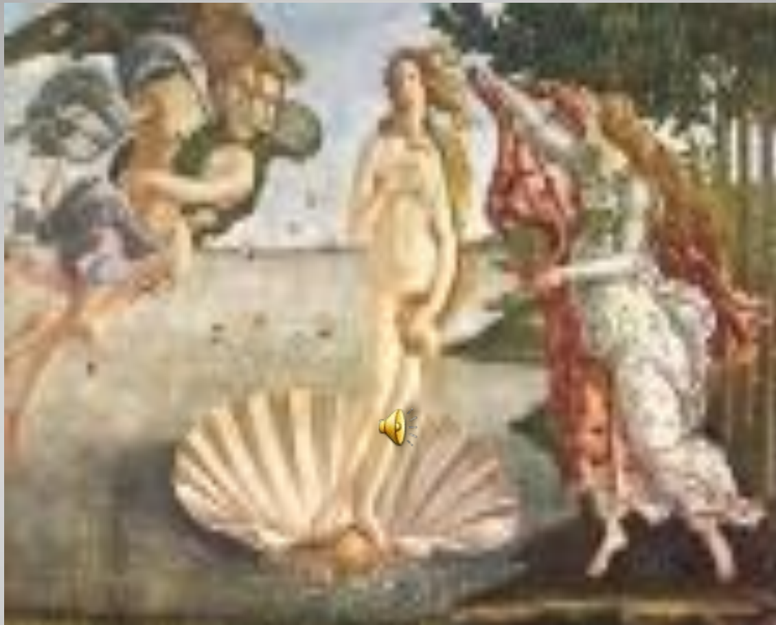
«Рождение Венеры» Художник Сандро Боттичелли