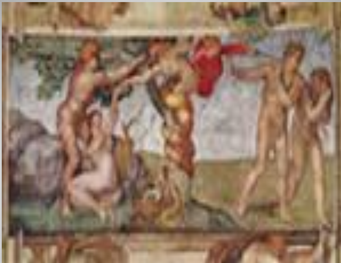
«Роспись потолка Сикстинской капеллы»