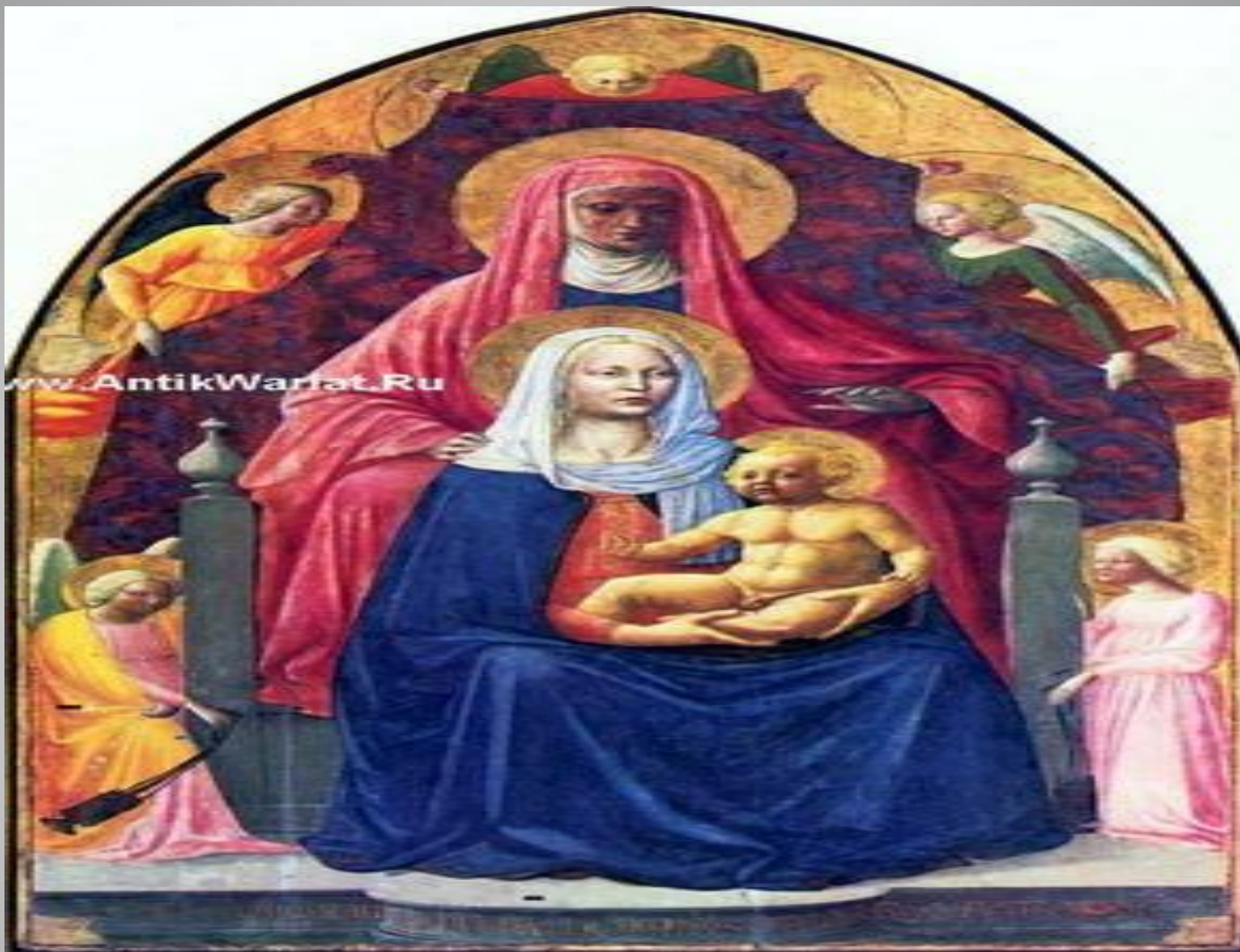
«Святая Анна...» художник Мазаччо