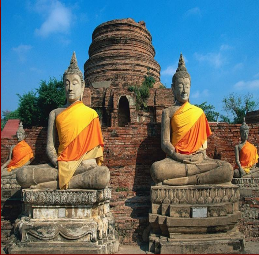
Образы бога Будды