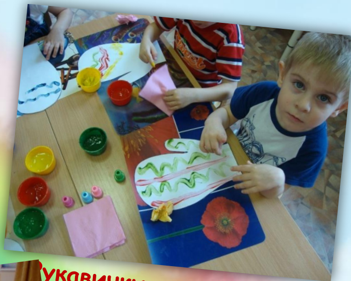
«Укавички для зверей»