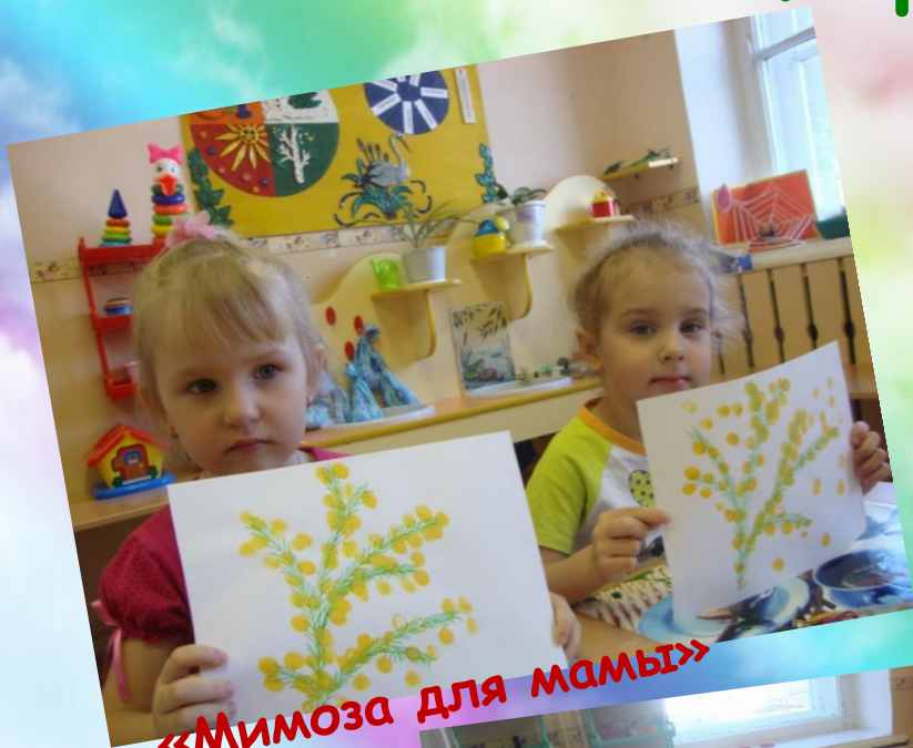
«Мимоза для мамы»