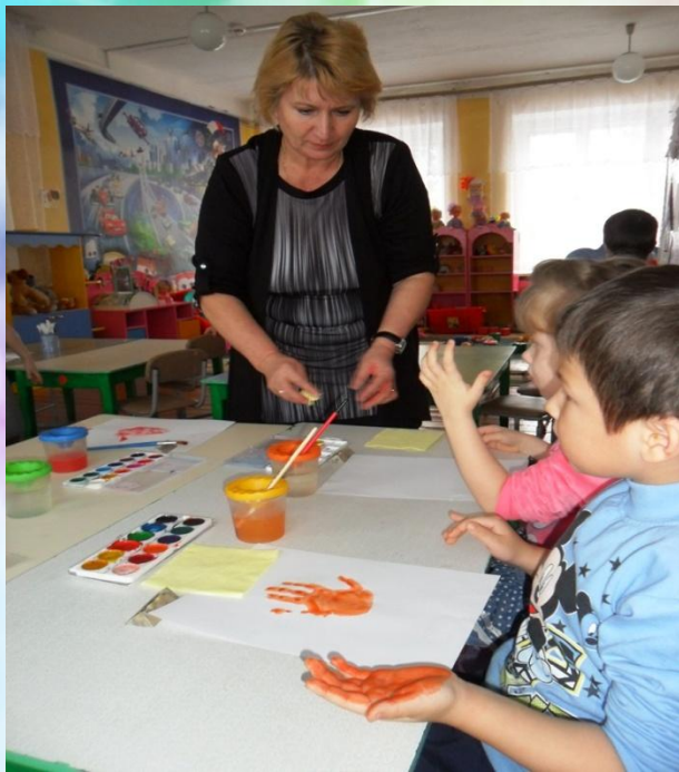
« Веселые осьминожки»