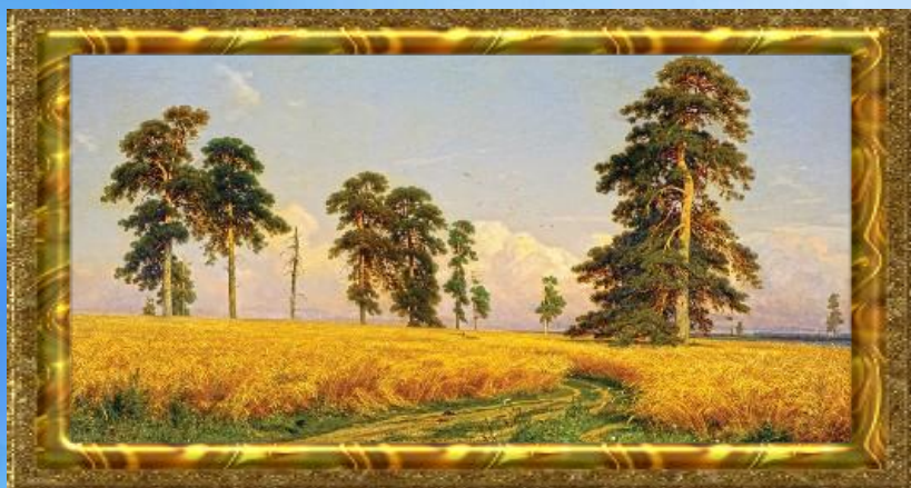
И.И. Шишкин «Пшеничное поле»