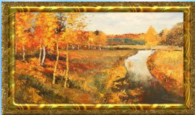
И.И. Левитан «Золотая осень»

Пейзаж – рисунок или картина изображающие природу. Пейзаж французское слово, дословный перевод – «местность» В пейзажной картине представлено изображение - открытого пространства водной или земной поверхности.