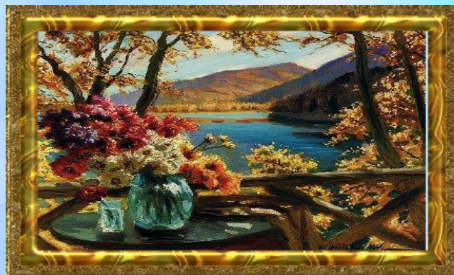
К.А. Вещилов «Ваза с цветами»

Натюрморт – это жанр изобразительного искусства. Произведения этого жанра – изображение предметов или природных форм. На этих картинах художники передают красочное богатство и разнообразие предметного мира.