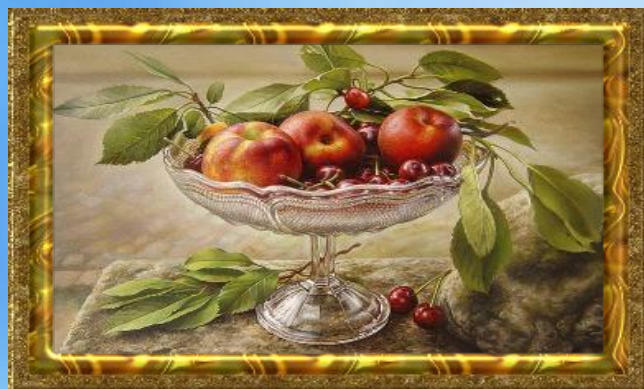
И. Ильева «Урожай»