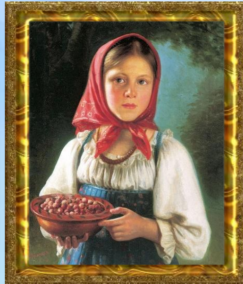
В. Тимофеев «Девочка с ягодой»