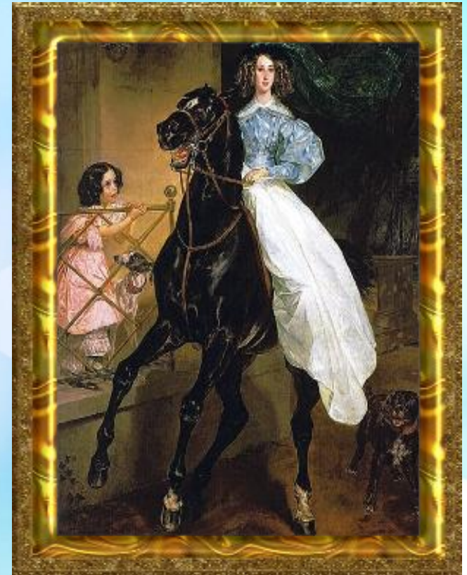
К. Брюлова «Всадница»