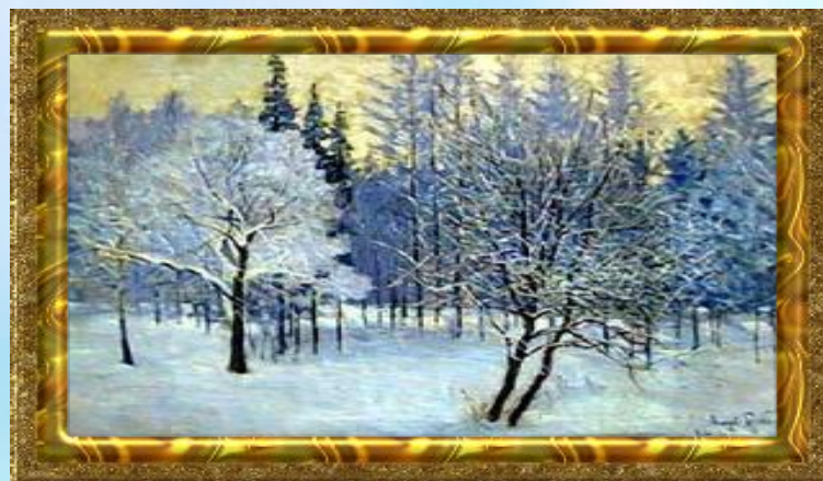
И.Э. Грабарь «Зимушка»