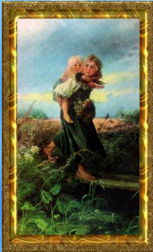
К.Е. Маковский «Дети бегущие от грозы»

Портретом называют картину с изображением человека или группы людей. В портретах художники стремятся не только точно передать внешнее сходство, но и характер человека.