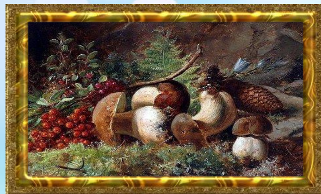
В. Тимофеев «Дары лес»