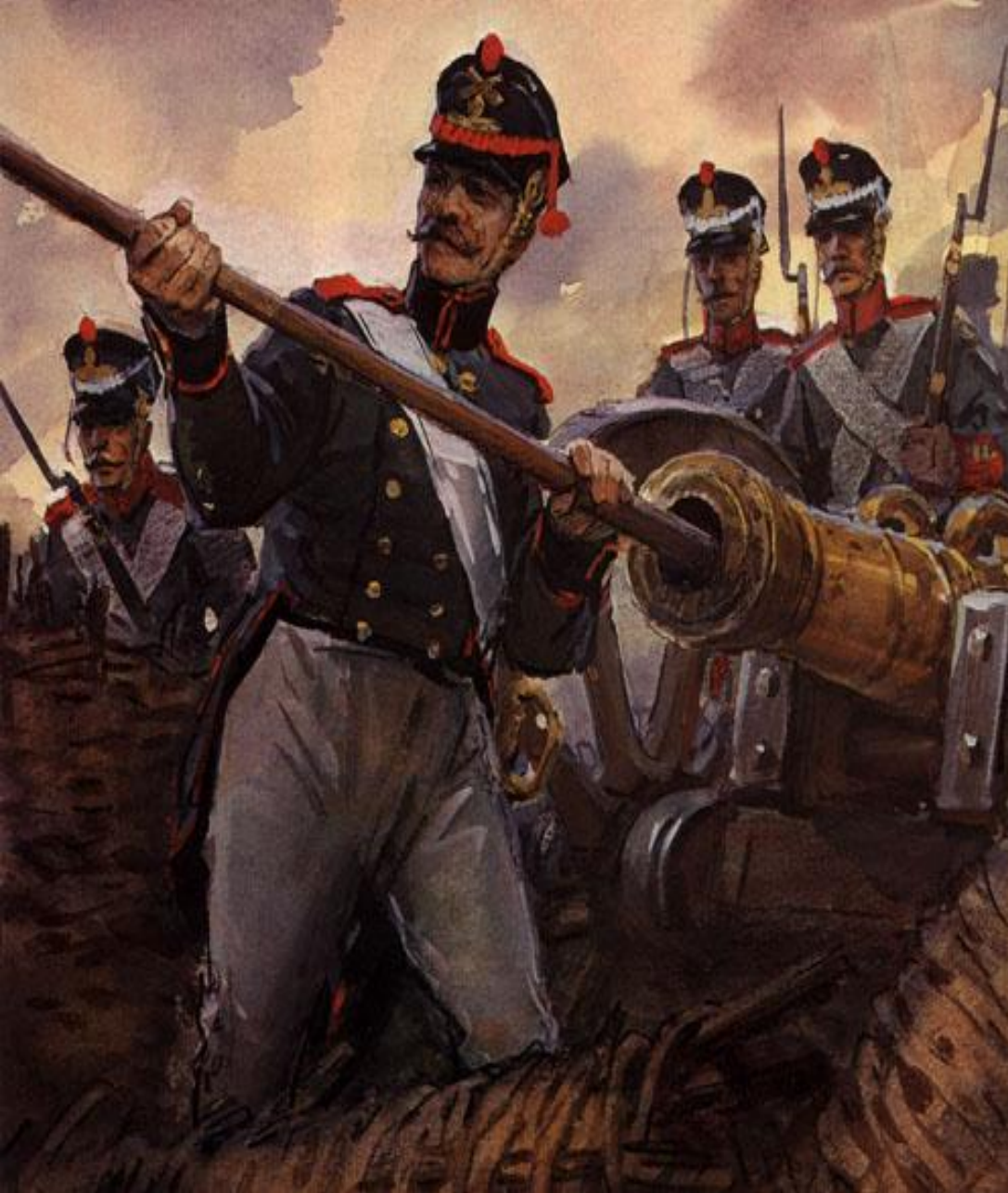
В. Шевченко. Артиллеристы на Бородинском поле.