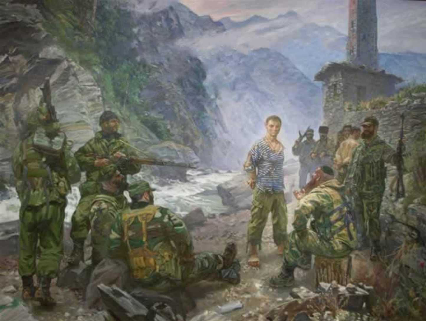
Картина русского православного художника Максима Фаюстова: «Русский мученик Евгений Родионов».