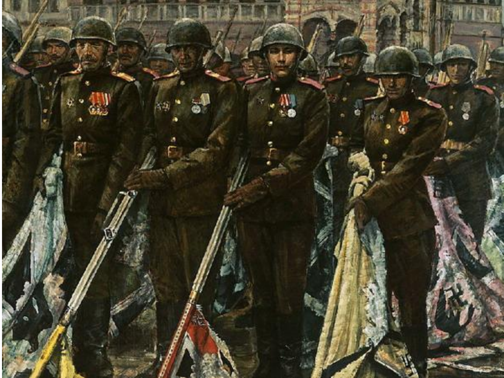
К. Антонов. «Победители».