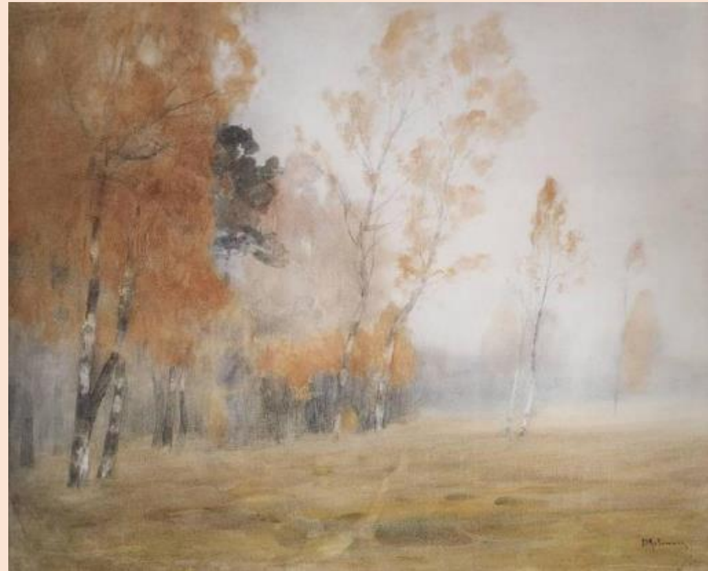
Осень. Туман. Исаак Левитан