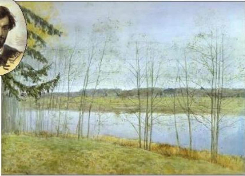
Осень. Исаак Левитан

Отправляемся в гости к осени и рассмотрим эти признаки в иллюстрациях и шедеврах русской пейзажной живописи