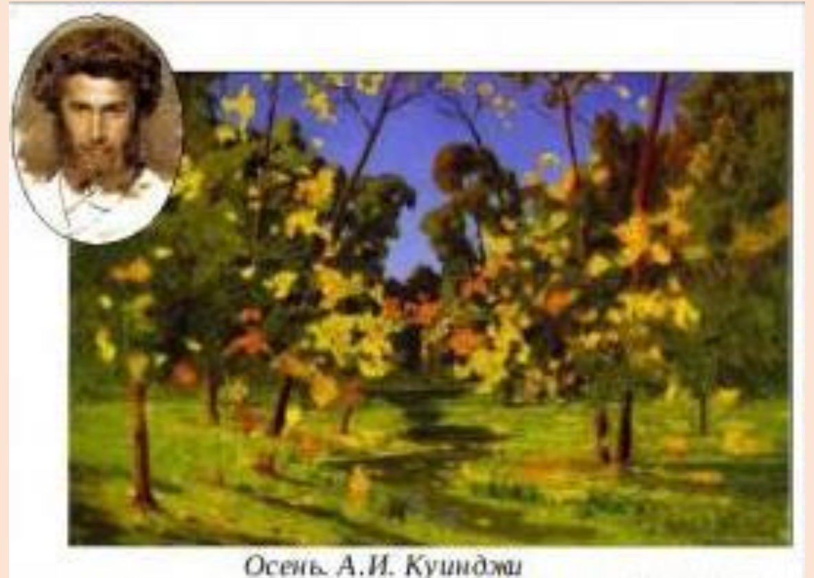
Осень. А.И. Куинджи

иллюстрации художника А. Белюкина на стихи А.Пушкина в книге "Уж небо осенью дышало":