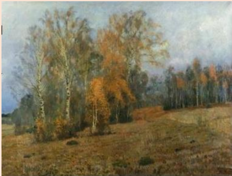
Октябрь. Осень. Исаак Левитан

Отправляемся в гости к осени и рассмотрим эти признаки в иллюстрациях и шедеврах русской пейзажной живописи