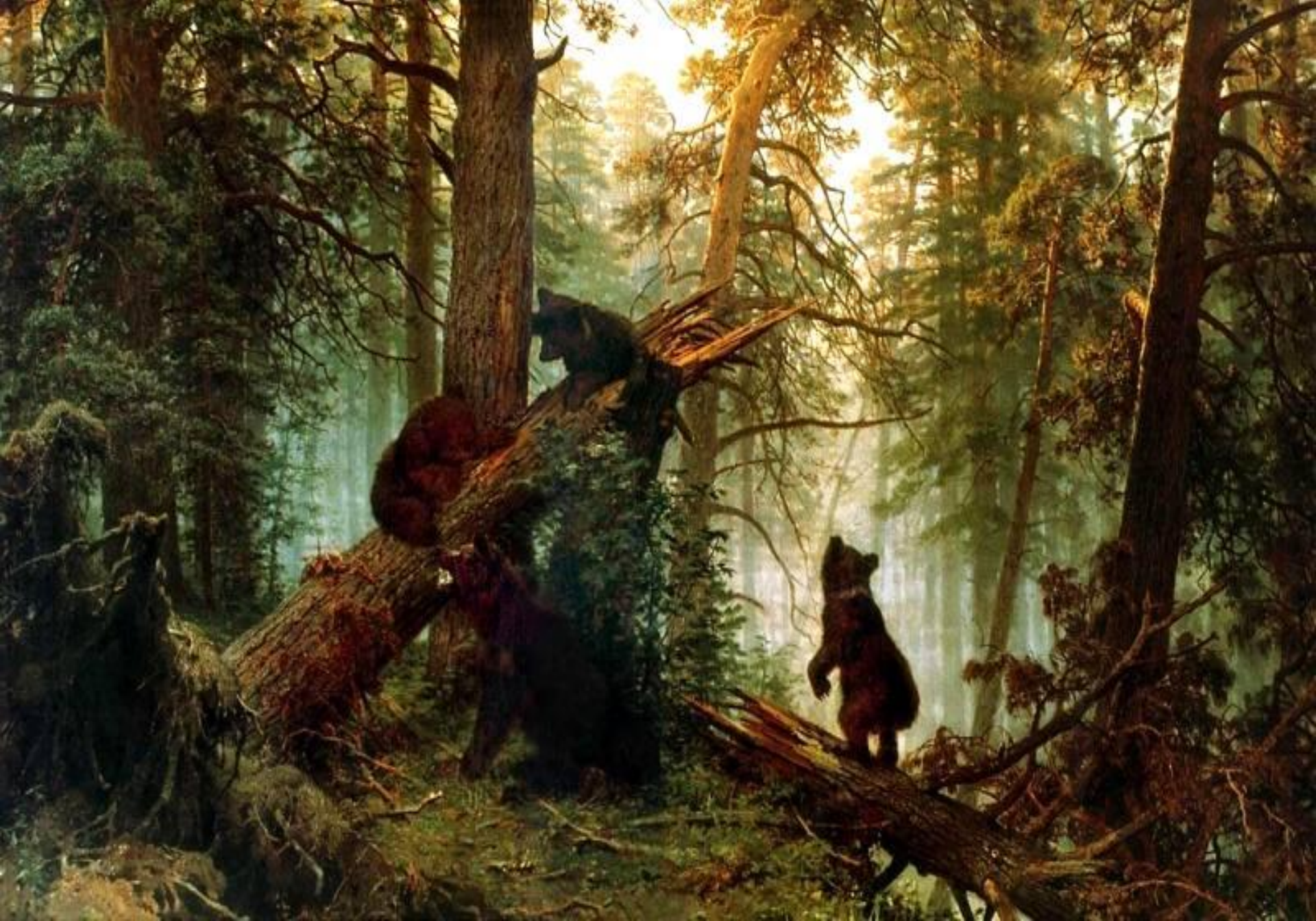
Утро в сосновом лесу