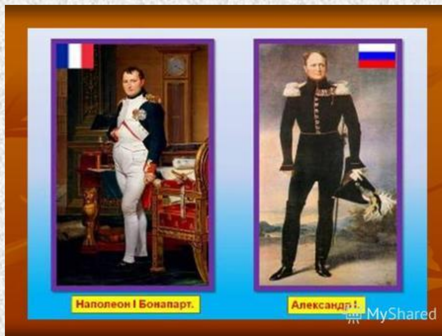
Наполеон I Бонапарт.