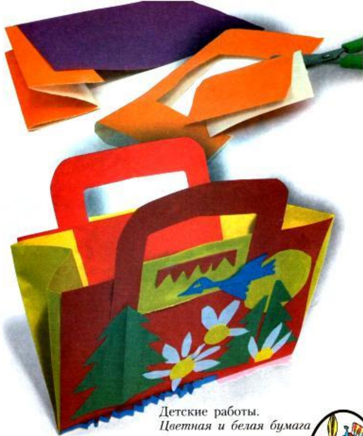
Детские работы. Цветная и белая бумага