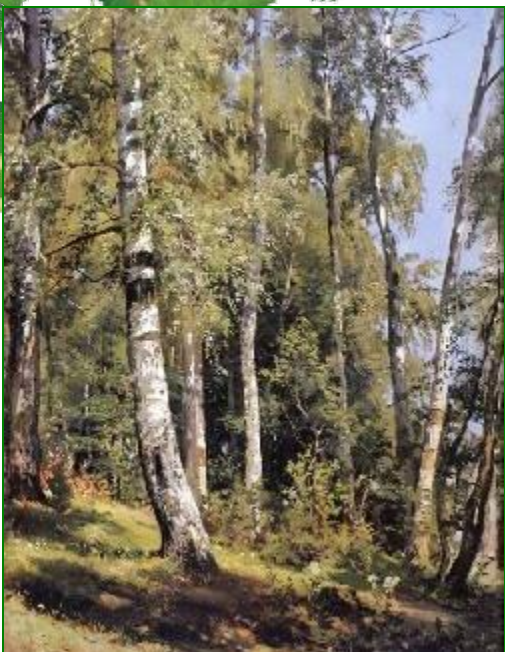
И.Шишкин «Берёзовая роща»