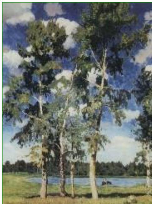
И.Грабарь «На озере»