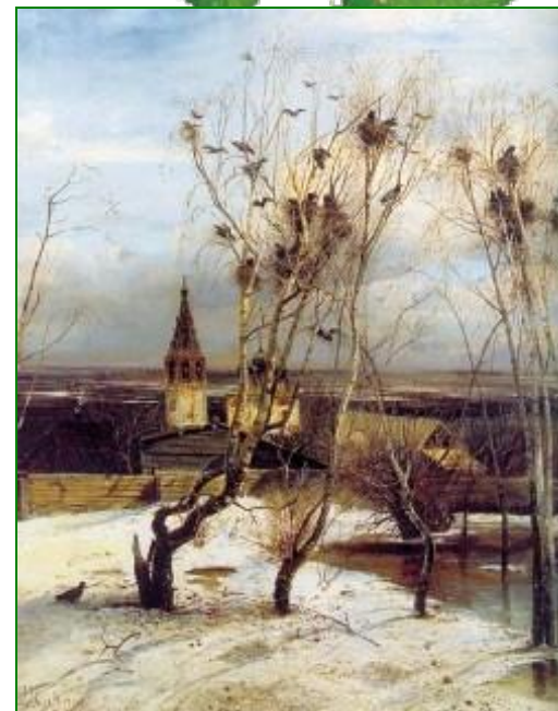
А.Саврасов «Грачи прилетели»