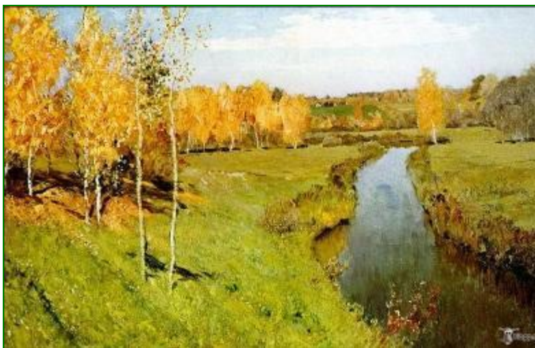
И.Левитан «Золотая осень»