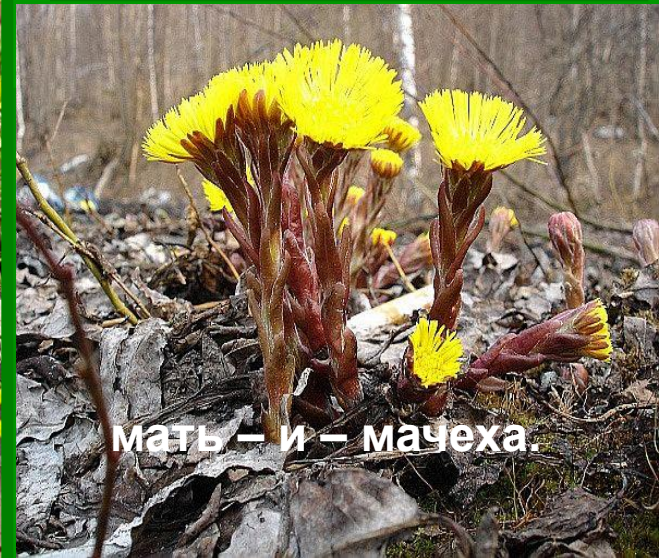
мать – и – мачеха.