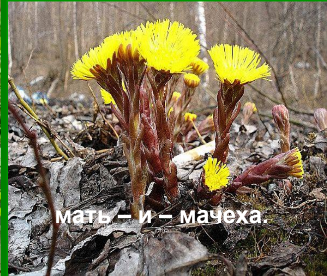
мать – и – мачеха.