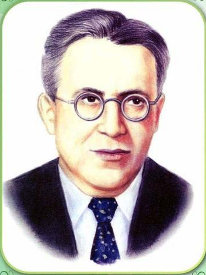
МАРШАК Самуил Яковлевич