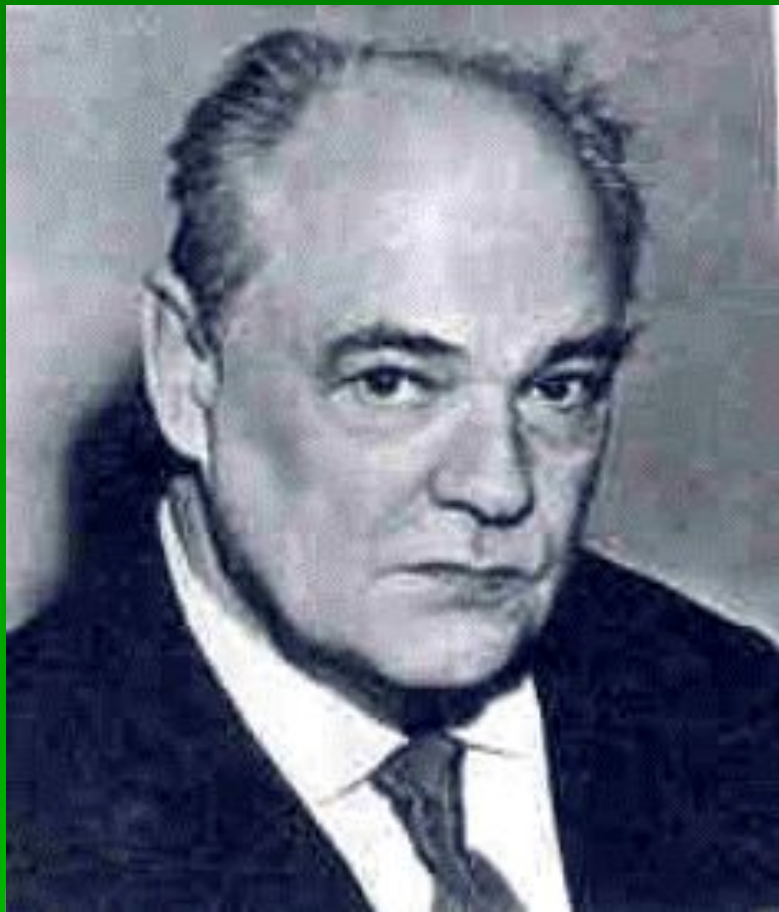
Евгений Иванович Чарушин — писатель и художник

Герои Е.И.Чарушина — животные: и домашние, и дикие, и экзотические жители дальних стран. Всякий зверь и птица для него — не животное «вообще», а конкретное живое существо со своим строением, пластикой, повадками, выражающими суть его характера.