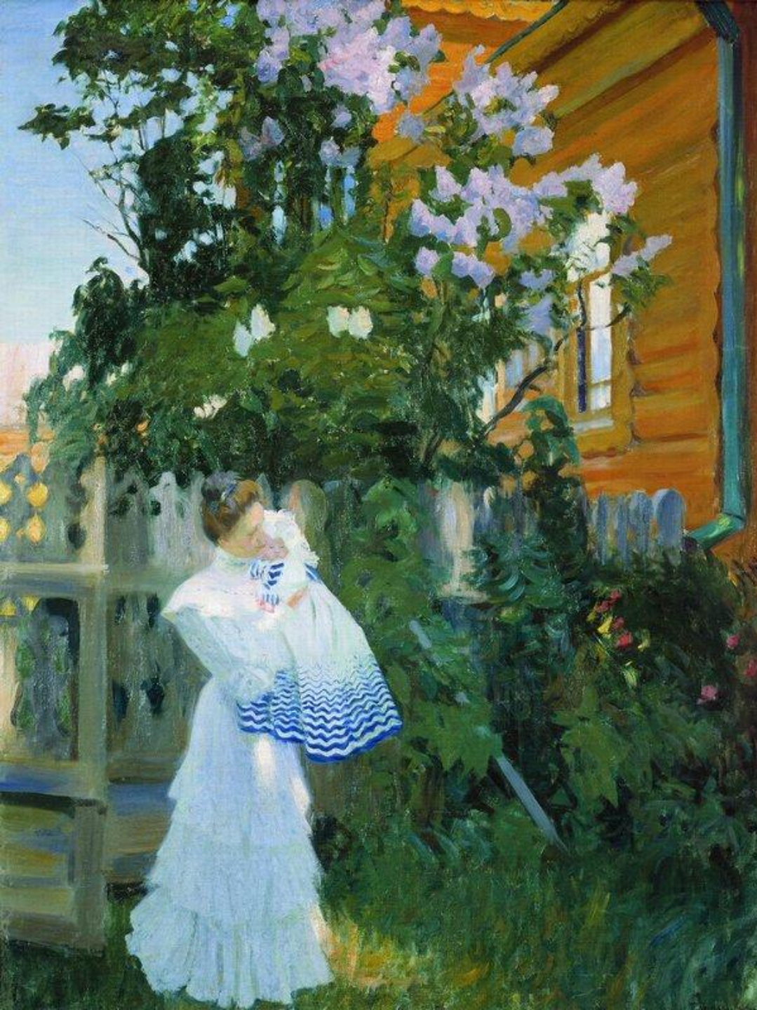
Б.Кустодиев «Сирень». Фрагмент. 1906