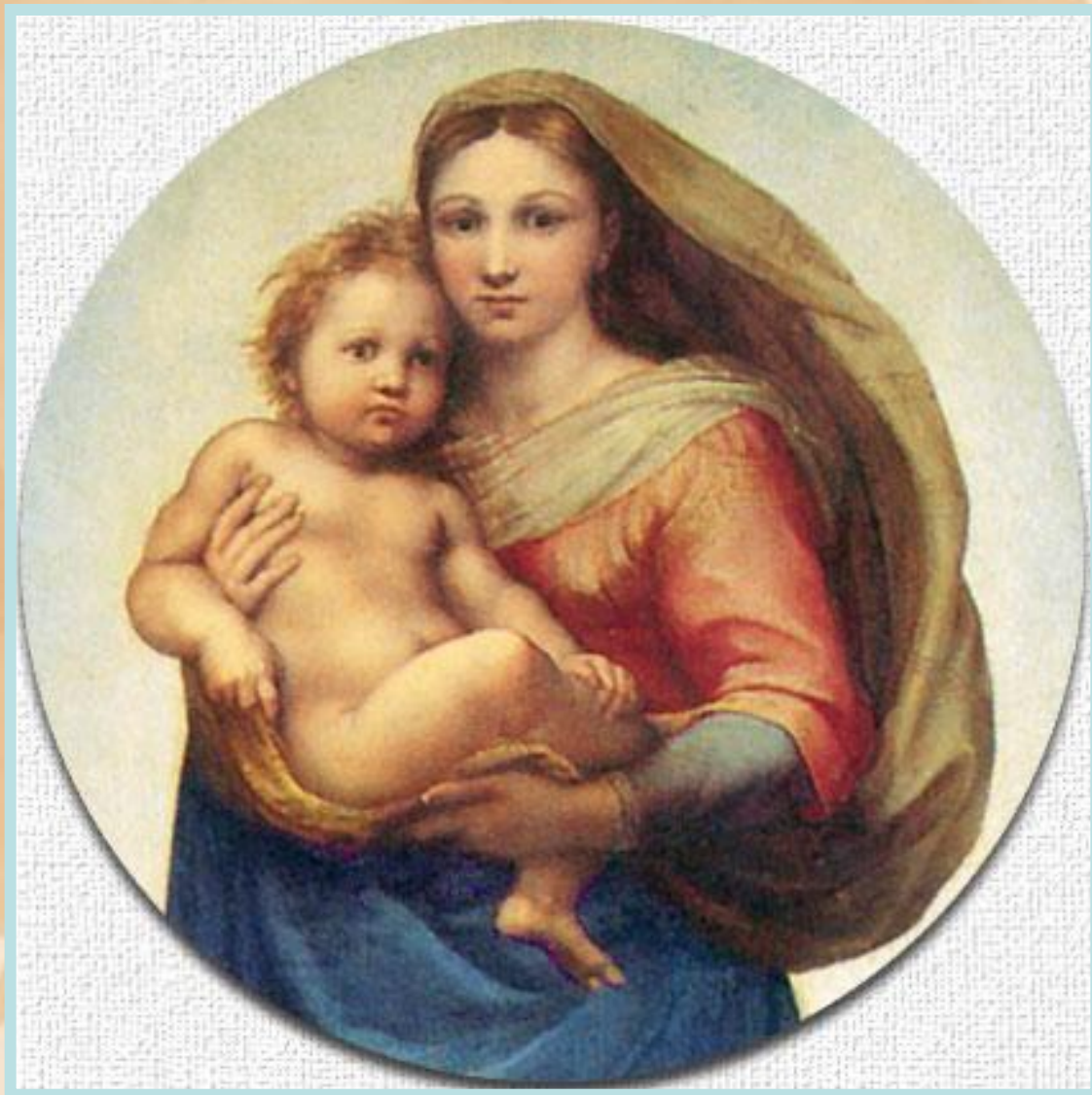
Рафаэль Санти. «Сикстинская мадонна. Мария и Христос». 1512-1515.