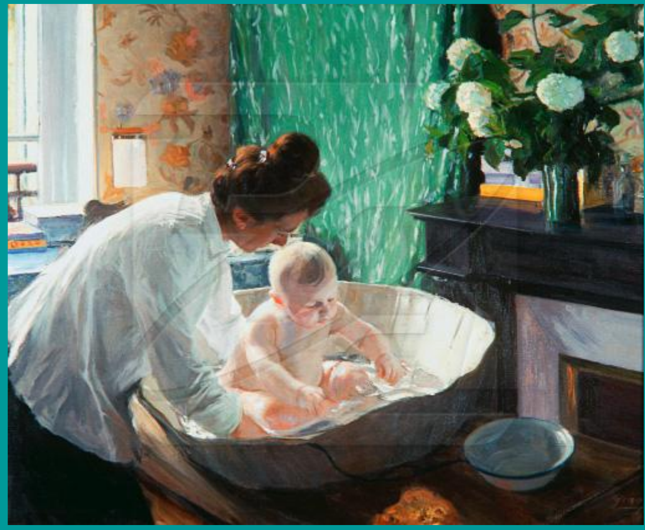
Б.Кустодиева. «Утро». 1904.