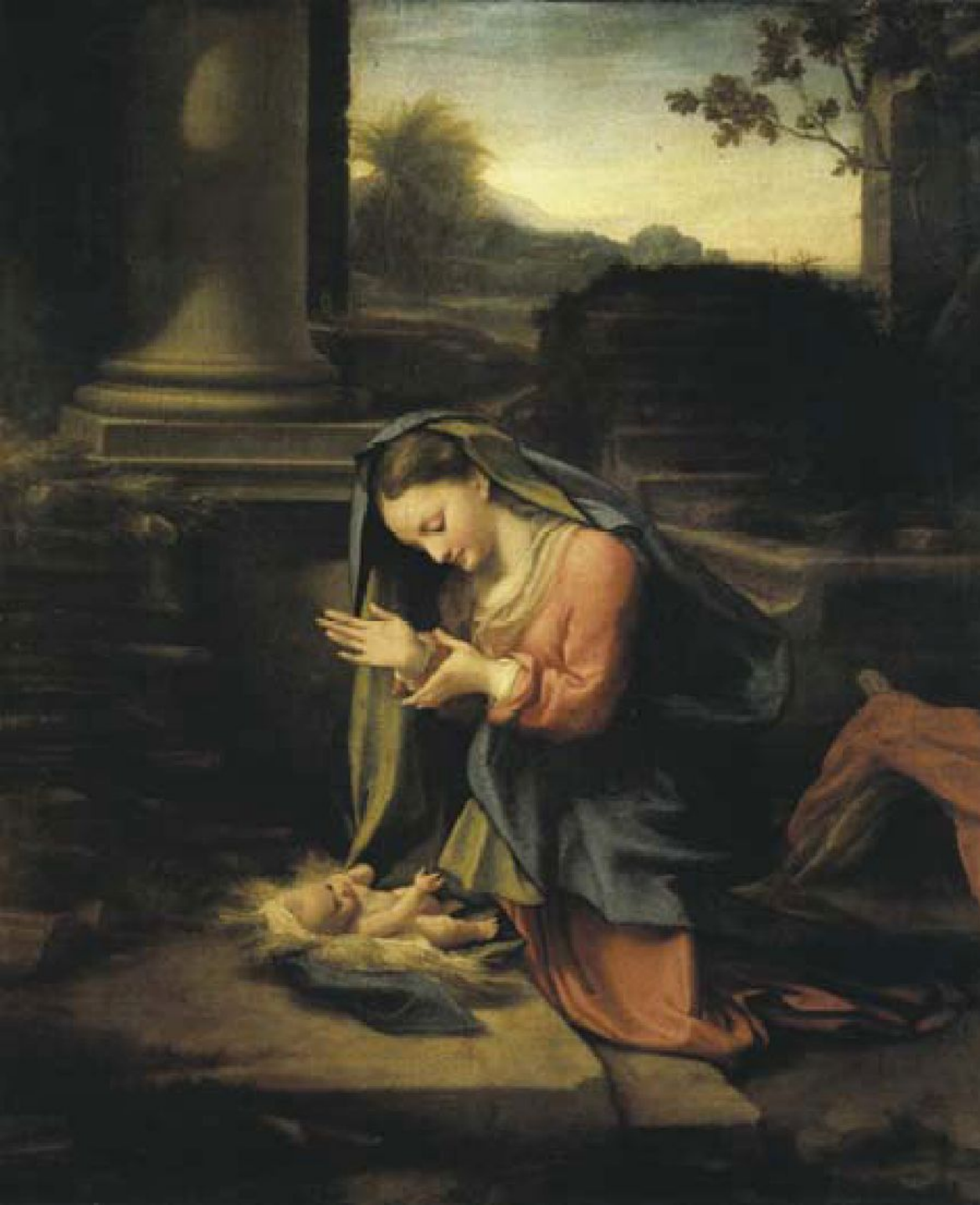
Корреджо. «Поклонение младенцу Христу». Ок.1520.