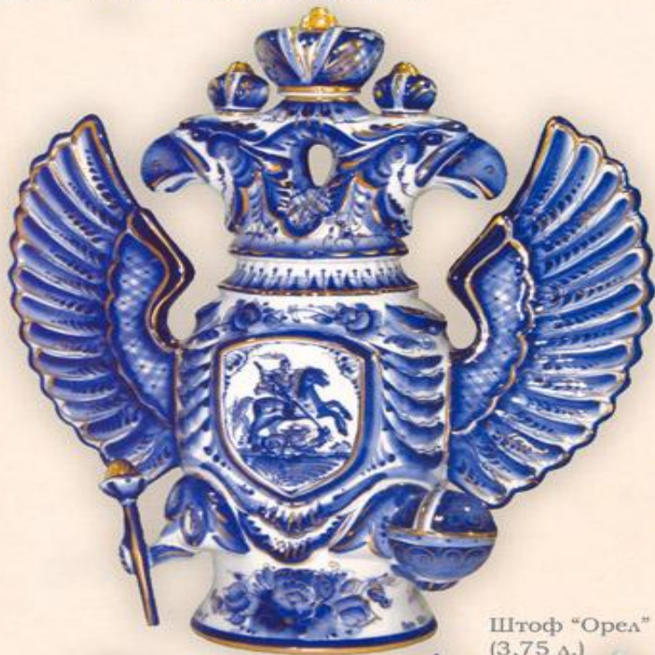
Штоф "Орел" (3,75 л.)