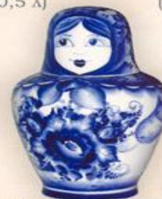
Штоф "Матрешка" (0,75 л.)