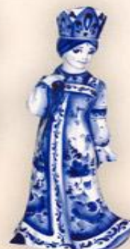
Штоф "Русская красавица" (0,75 л.)