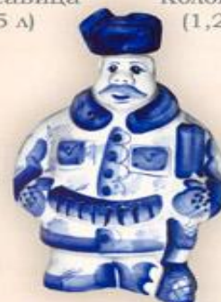
Штоф "Егерь" (0,5 л.)