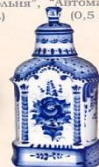
Штоф "Часовня" (0,5 л.)