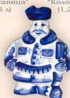
Штоф "Егерь" (0,5 л.)