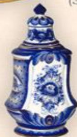
Штоф "Весенний" (0,75 л.)