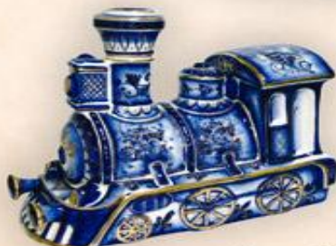
Штоф "Паровоз" (1,0 л.)