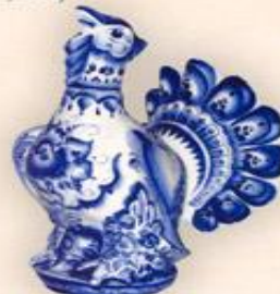
Штоф "Глухарь" (2,0 л.)