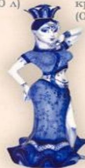
Штоф "Танцовщица" (1,2 л.)