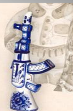
Штоф "Автомат" (0,5 л.)