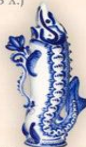
Штоф "Осетр" (1,0 л.)