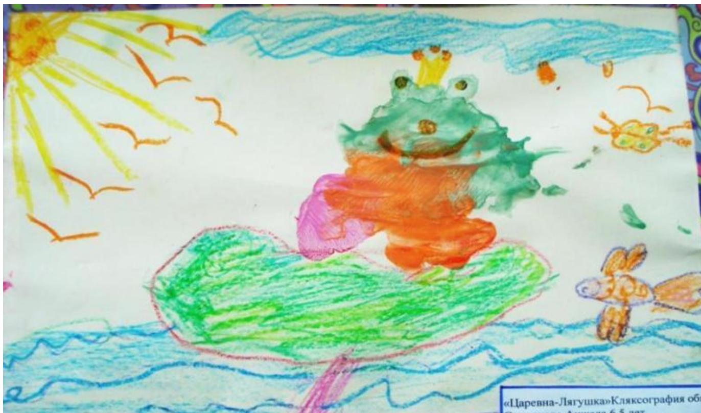
«Царевна-Лягушка» Кляксография обь Создана 6.5 лет

КЛЯКСОГРАФИЯ - такой вид рисования, который относится к нетрадиционным техникам, с помощью которого можно весело и с пользой провести время, поэкспериментировать с красками, создать необычные образы.