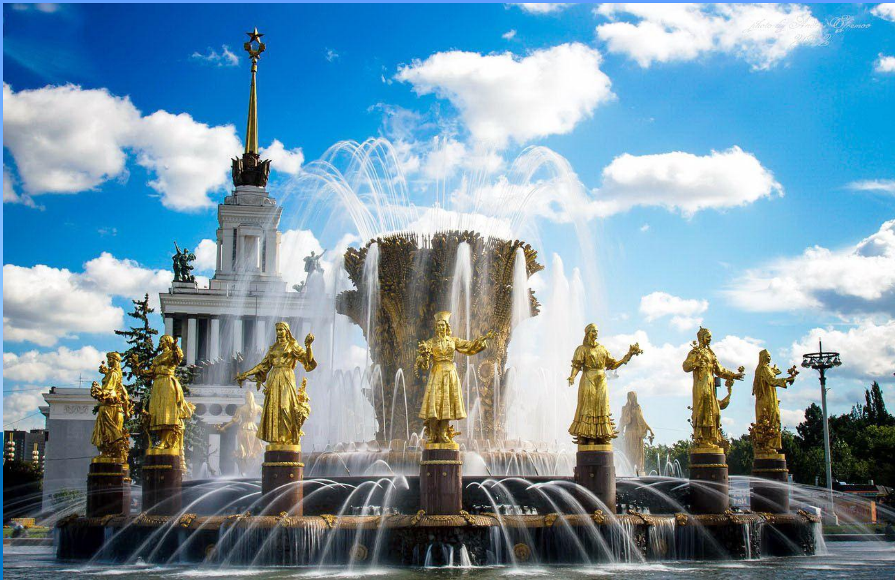
Фонтан «Дружба народов» в Петербурге