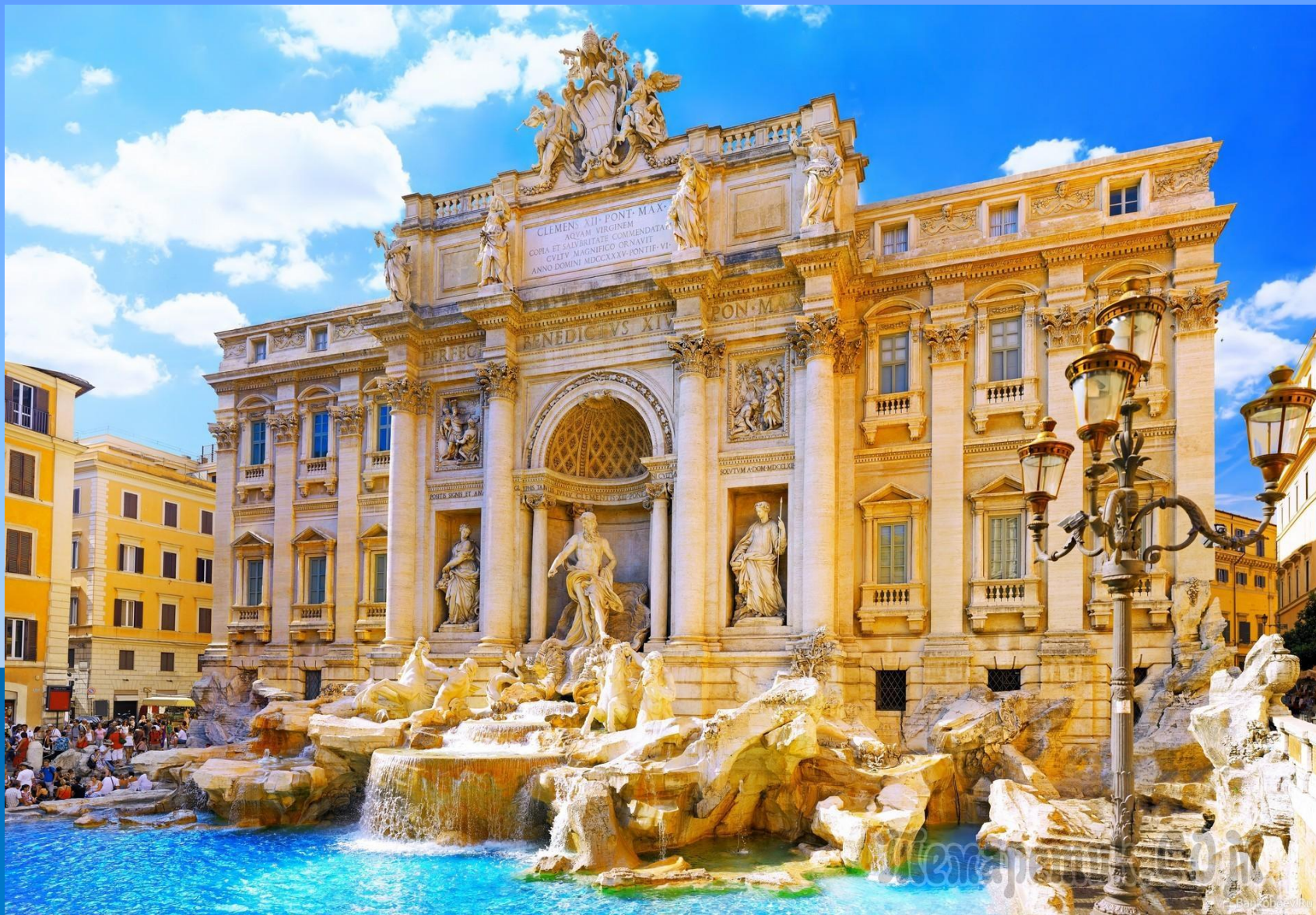
Фонтан в Риме (Италия)