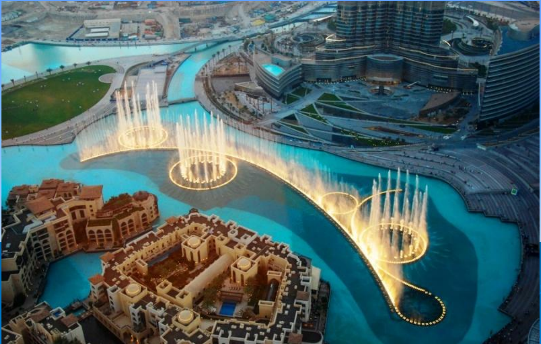
Музыкальный фонтан Дубая (ОАЭ)