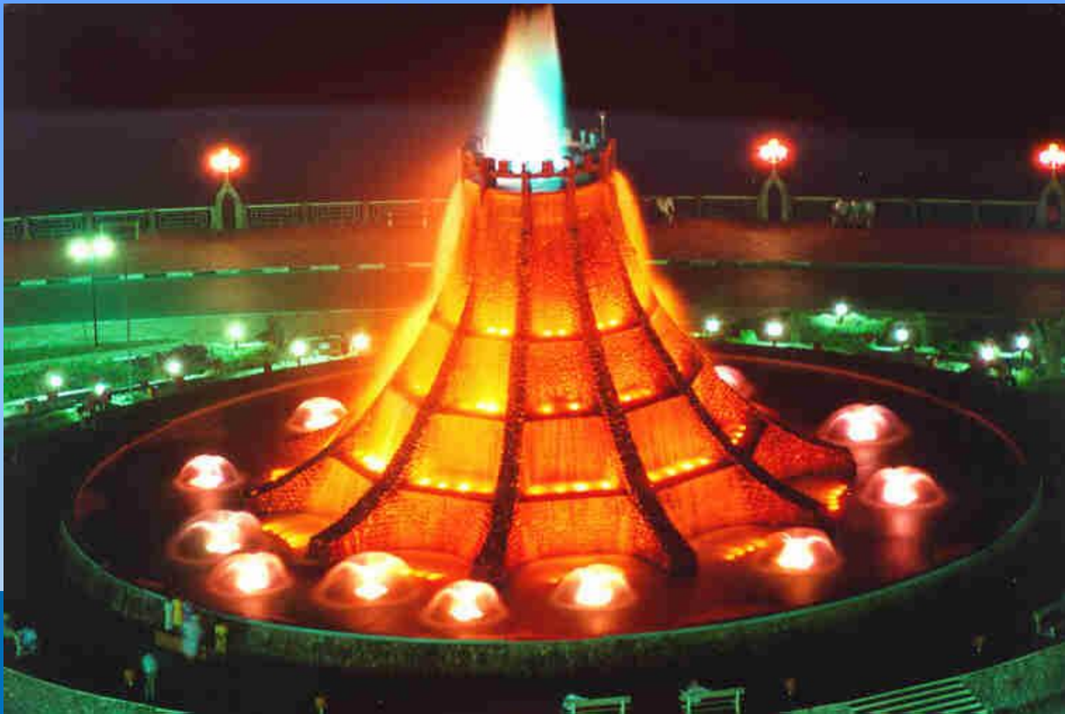
Фонтан – вулкан в Абу-Даби (ОАЭ)