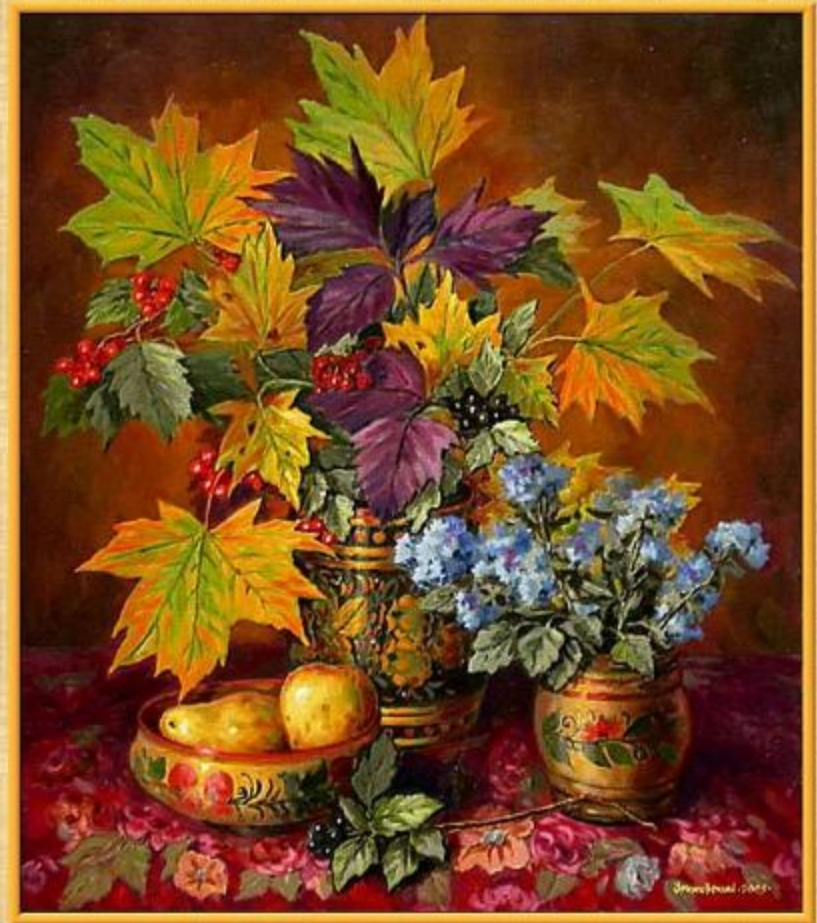
Пример сюжетно-тематического натюрморта. Тема: осень