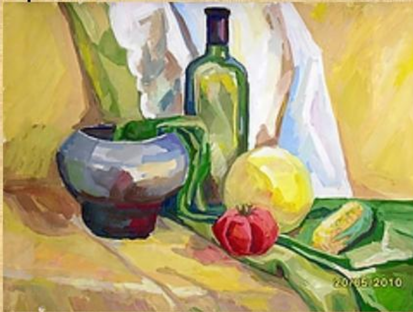
Пример учебной работы в зеленых тонах