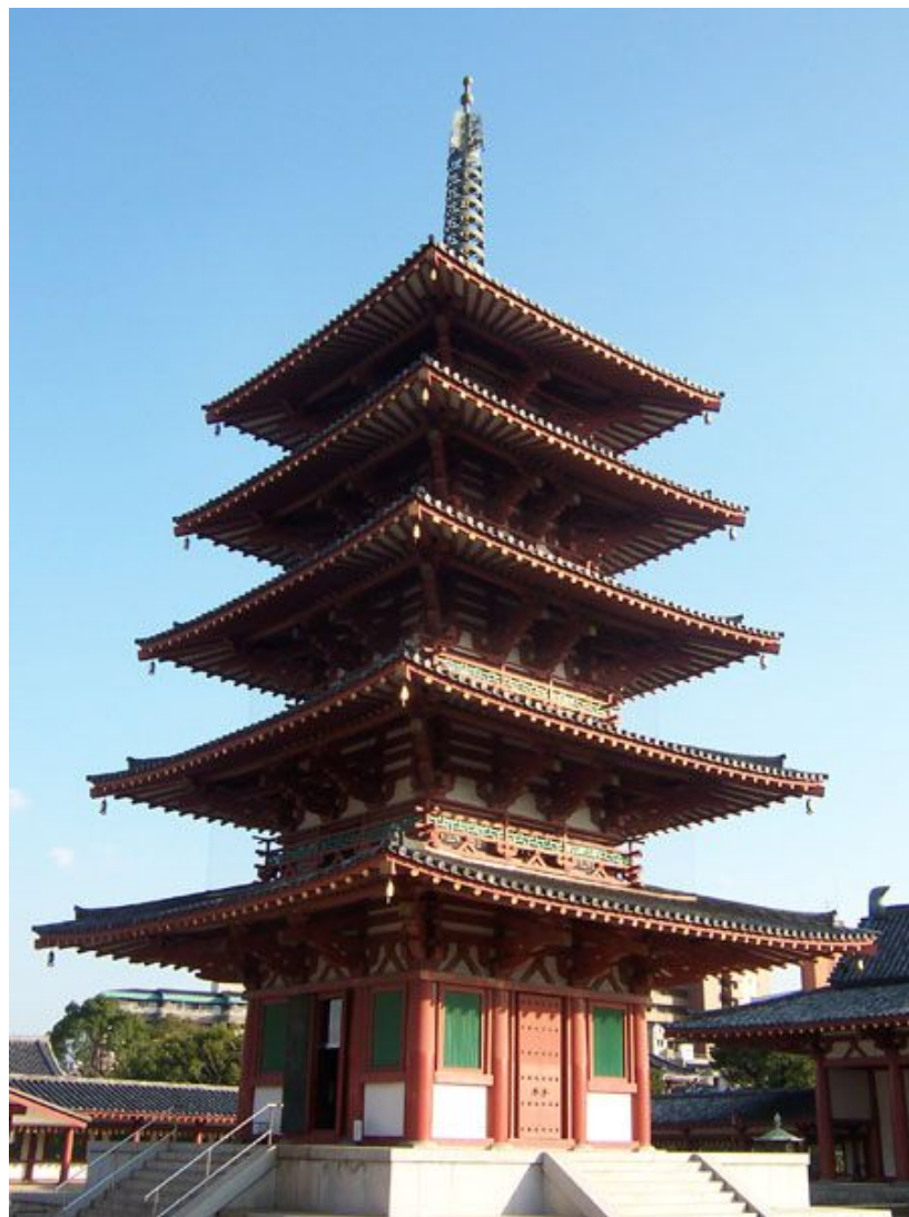
Храм-пагода Shitenoji в Осака 593 г сооружен по приказу принца Сётоку

Сравни конструкцию храма-пагоды и русского каменного храма.