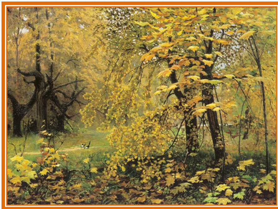
Остроухов И.С. «Золотая осень»