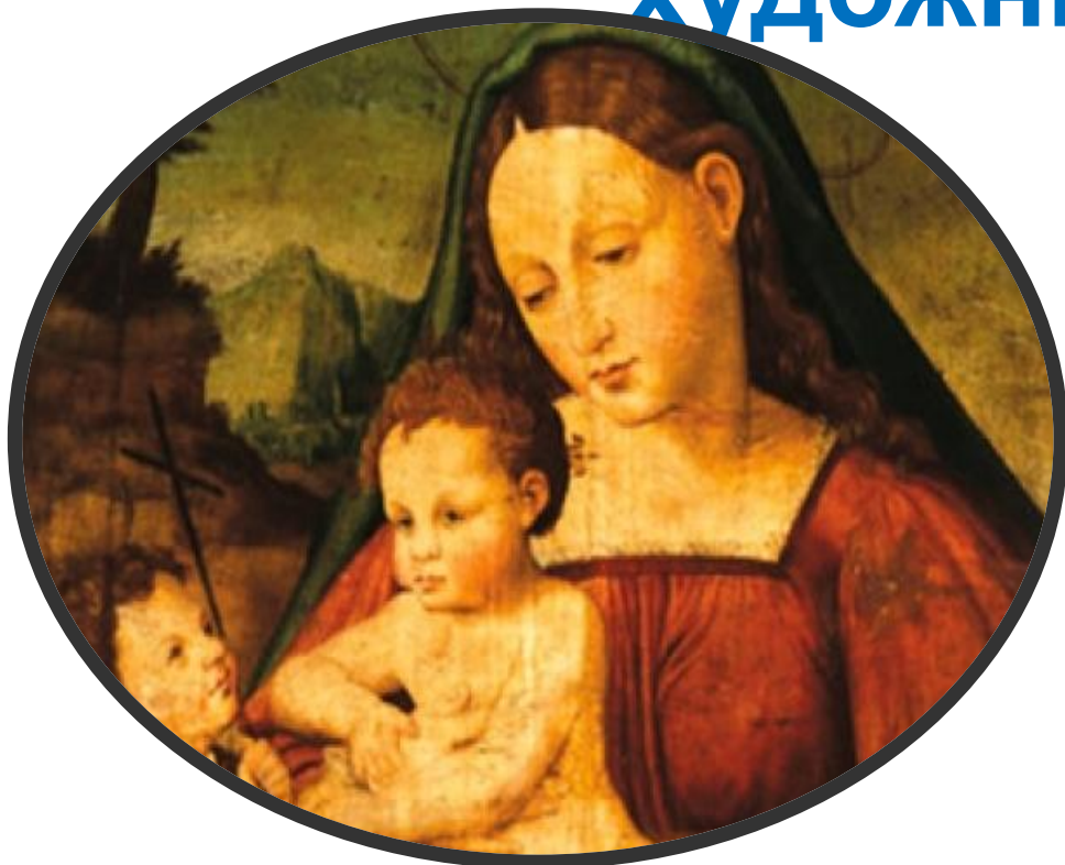
Леонардо да Винчи