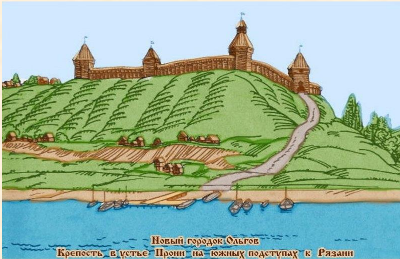
Новый городок Ольгов Крепость в устье Прони на южных подступах к Рязани