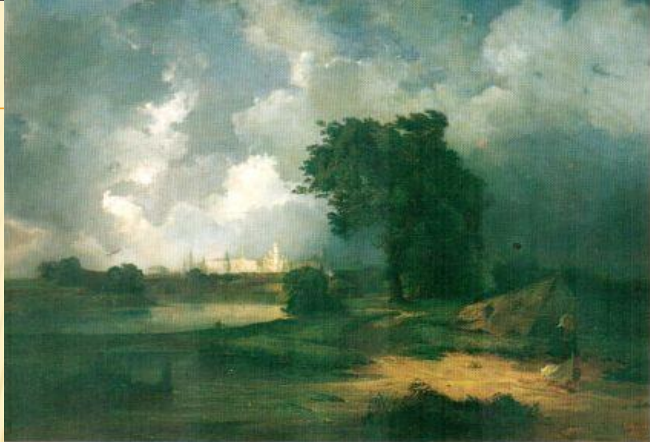
А.К.Саврасов (1830-1897) «Вид на Кремль в ненастную погоду. 1851г.»

находилась. В 1902-1904 годах по рисунку В.Васнецова был построен её ныне существующий каменный фасад.