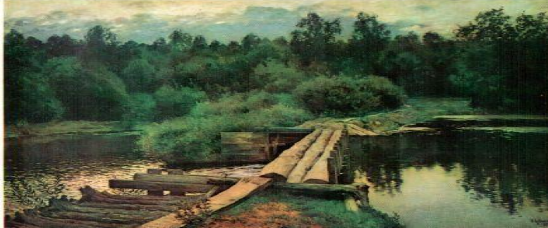
И.И.Левитан(1860-1900) «У омута», 1892г.

Русская интеллигенция горячо поддержала дело Третьякова, хорошо понимая принципы его собирательства, отличавшие его от других коллекционеров.