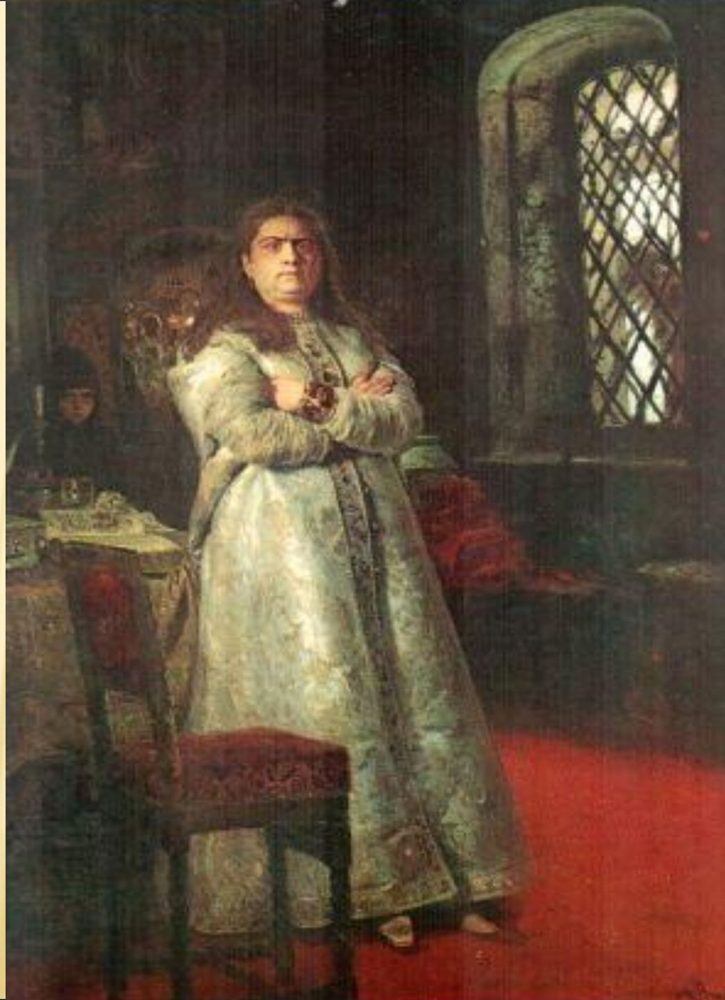
И.Е.Репин(1844-1930) «Царевна Софья Алексеевна.1879г.»