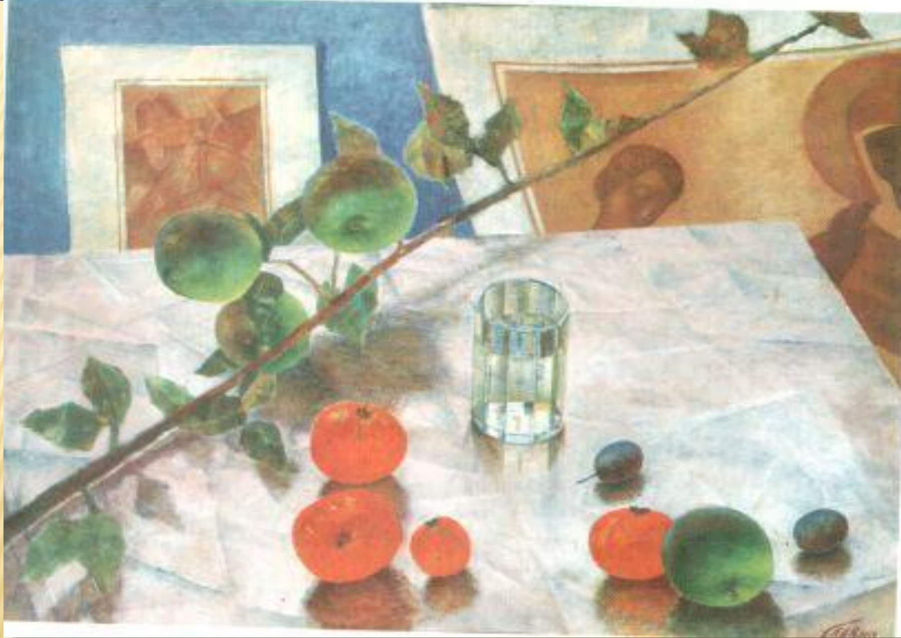
К.С.Петров-Водкин(1878-1939) «Розовый натюрморт. Ветка яблони».1918г.