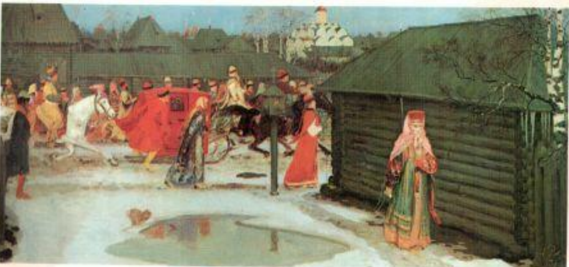
А.П.Рябушкин(1861-19040 «Свадебный поезд в Москве(17-е столетие)».1901г.