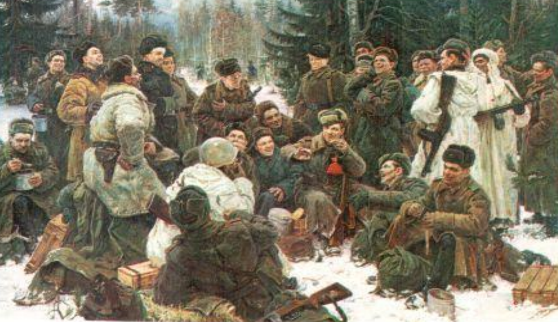
Ю.М.Непринцев(род.1909) «Отдых после боя» 1955г.