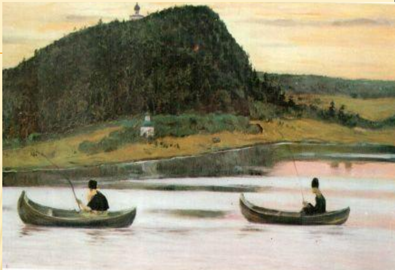
М.В. Нестеров (1862-1942). «Молчание».1903

«Я... желал бы оставить национальную галерею...Для меня, истинно и пламенно любящего живопись, не может быть лучшего желания, как положить начало общественного, всем доступного хранилища изящных искусств, приносящего