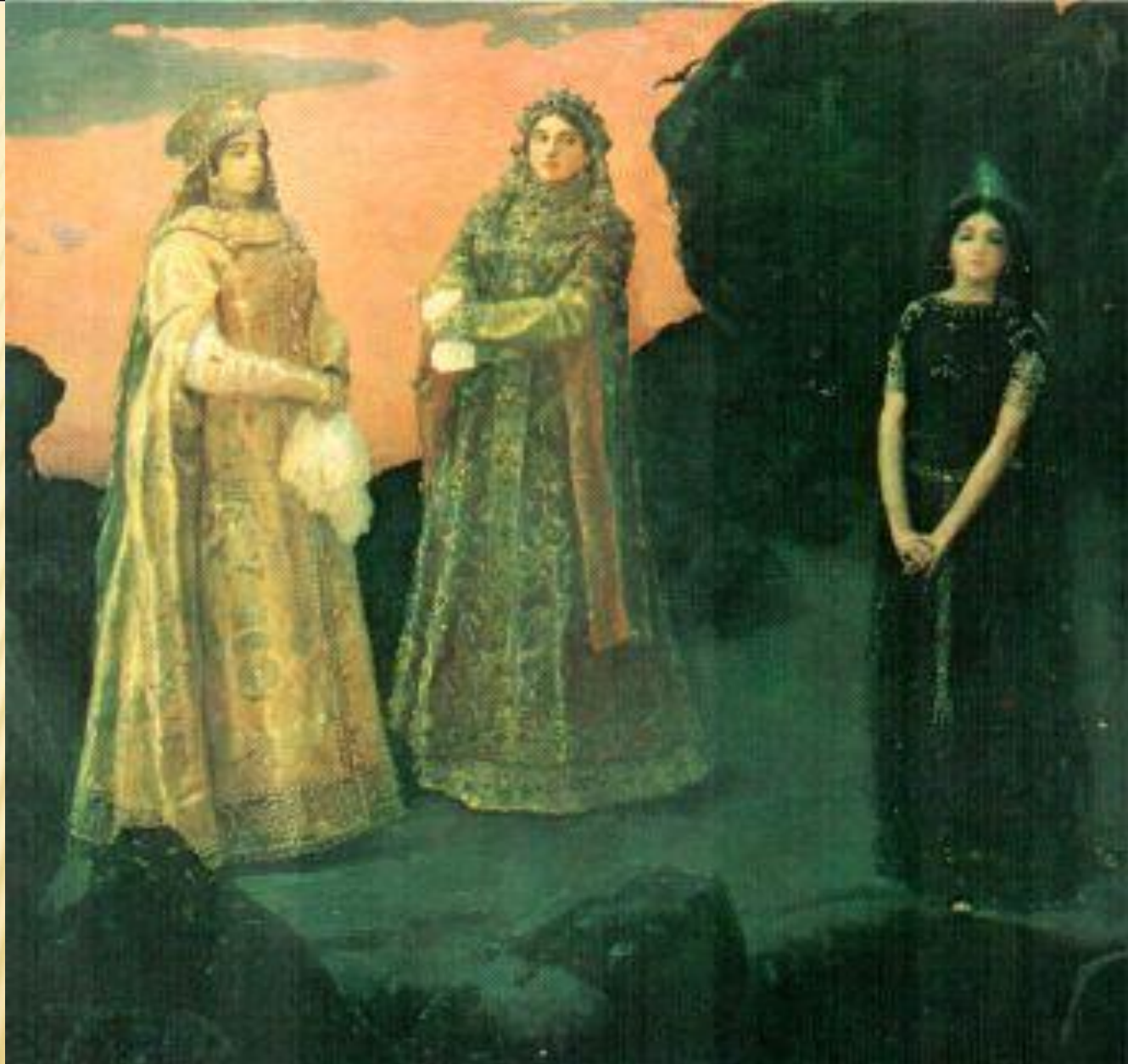
В.М.Васнецов (1848-1926) «Три царевны подземного царства. На сюжет русской народной сказки».1879г.