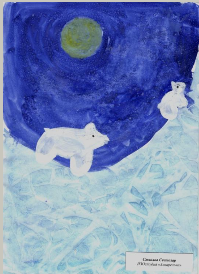
Светозар ИЗОстудия «Акварелька»

Различные техники прекрасно сочетаются между собой