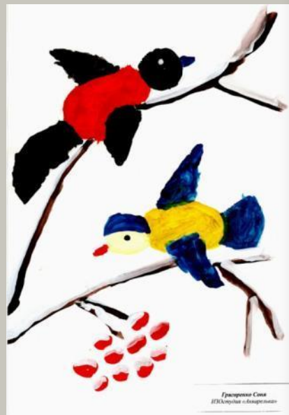
Григоренко Сова ИЖАмуря «Берестово»