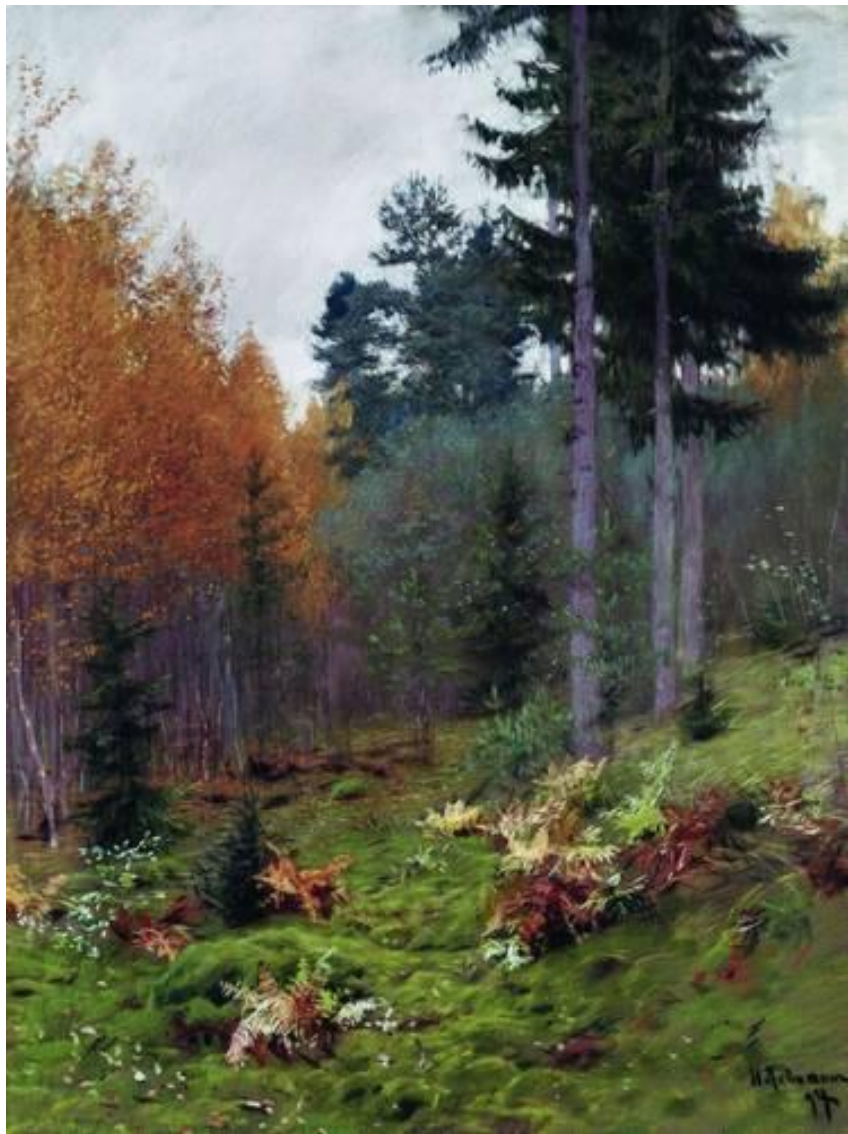
«В лесу осенью». И.И. Левитан