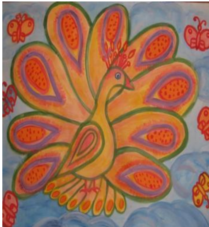
Рисунок наносится при помощи водоотталкивающего материала – свечки или сухого кусочка мыла, невидимые контуры не будут окрашиваться при нанесении поверх них акварельной краски, а будут проявляться, как это происходит при проявлении фотоплёнки.