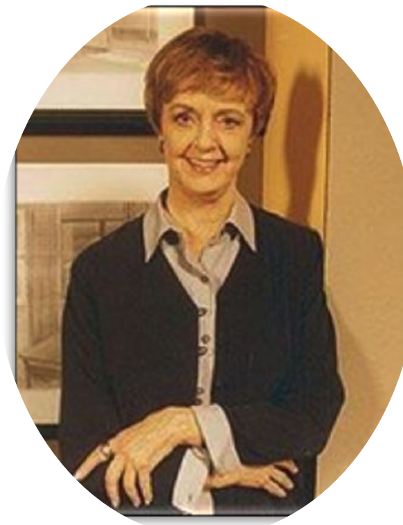
Бетти Эдвардс, американский профессор