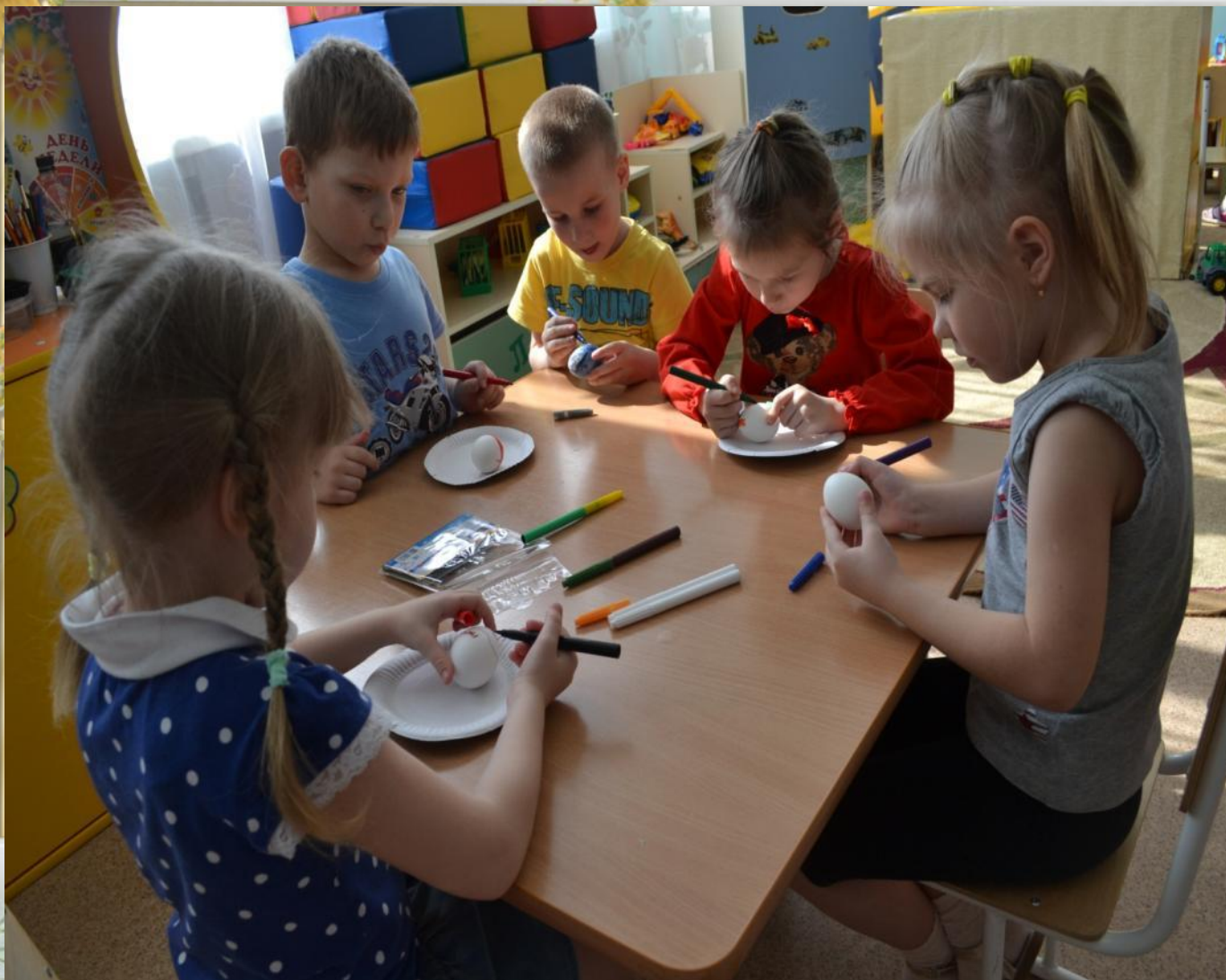
Фото отчет по проекту