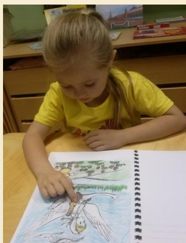
«Что перепутал художник»