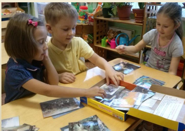
«Определи или найди жанр»