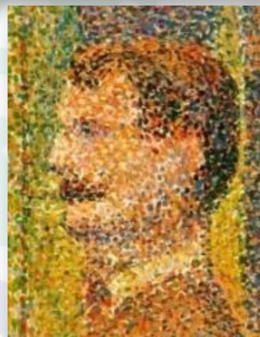
Парад (фрагмент картины).