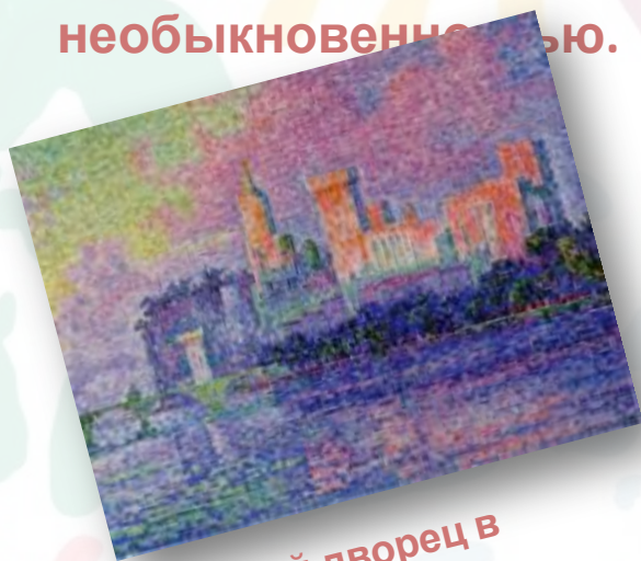
Папский дворец в Авиньоне