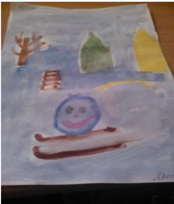
Снежный ком на лыжах