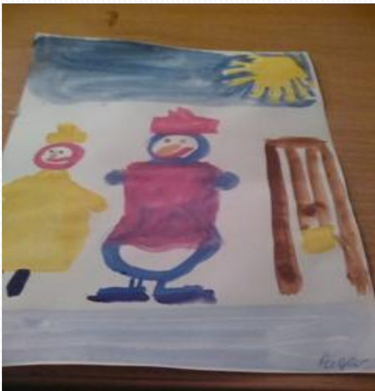
Веселый снеговик на коньках