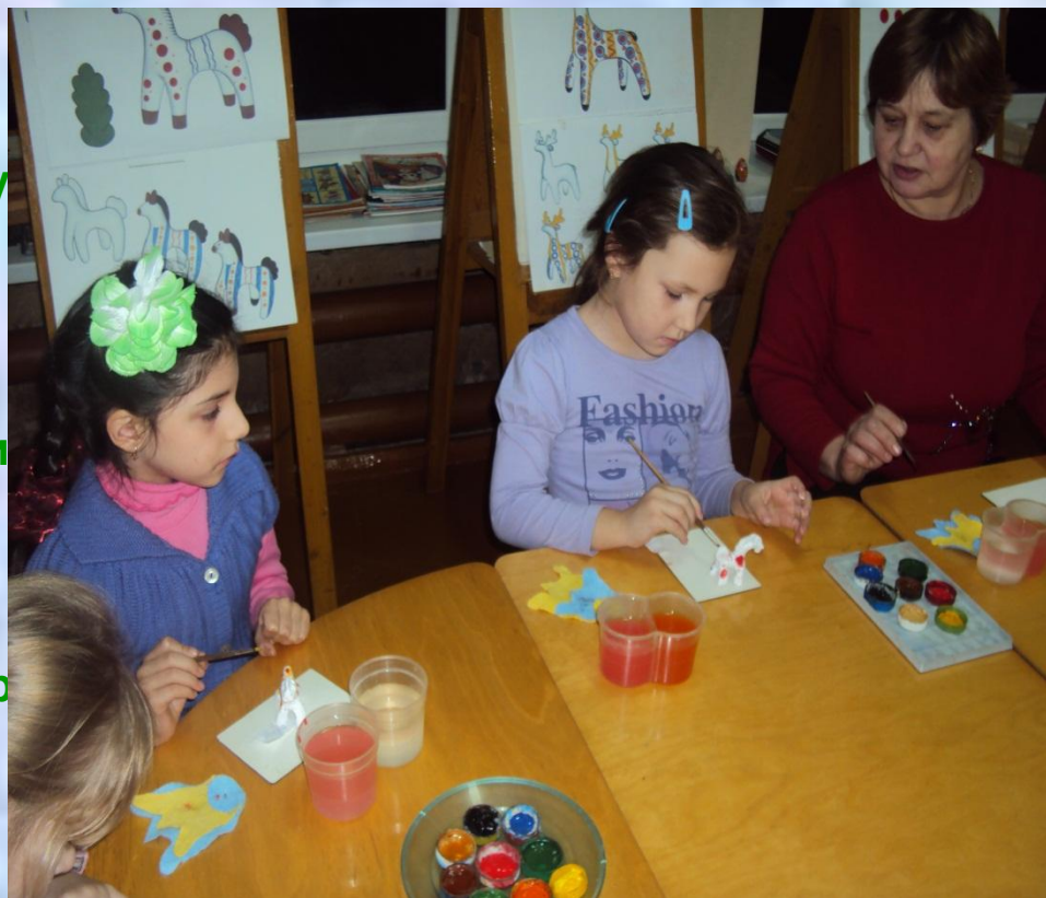
фото № 8