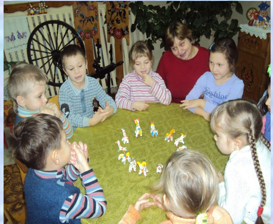
фото № 6