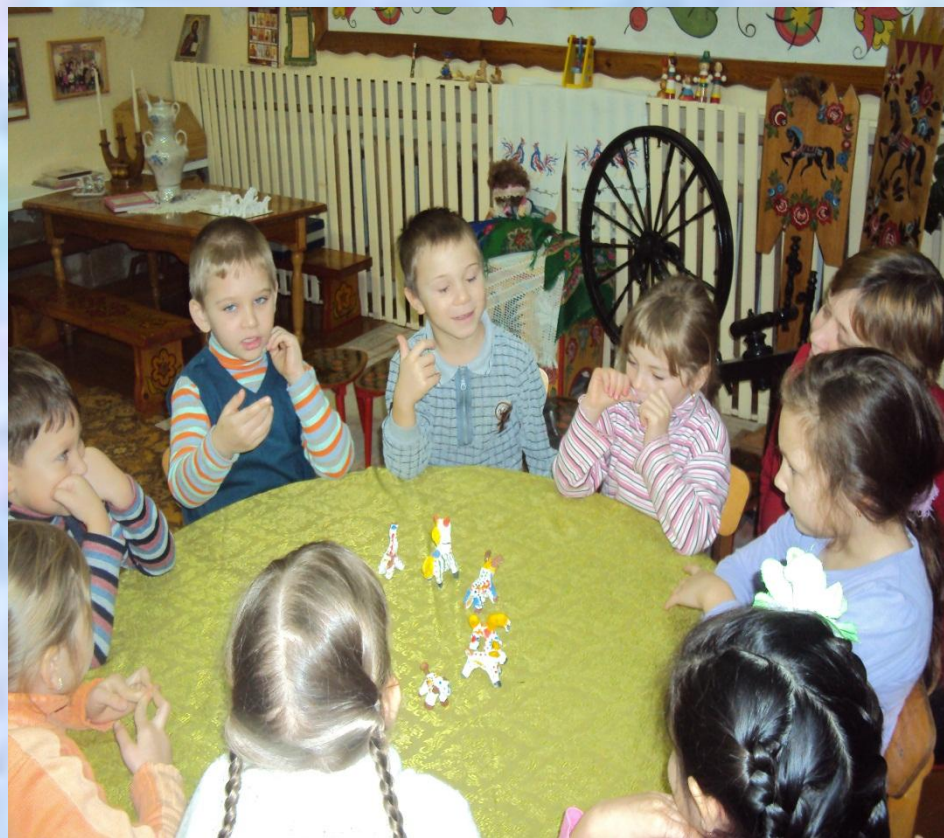
Фото № 7

Сегодня при росписи своей игрушки, вы тоже попробуйте взять узоры из природы. Только нужно помнить: использовать для росписи не меньше 4 цветов и узор с обеих сторон животного одинаковый. В процессе рисования советую детям использовать рациональный способ работы – закрашивать или рисовать одинаковые части и детали сразу на двух сторонах игрушки.