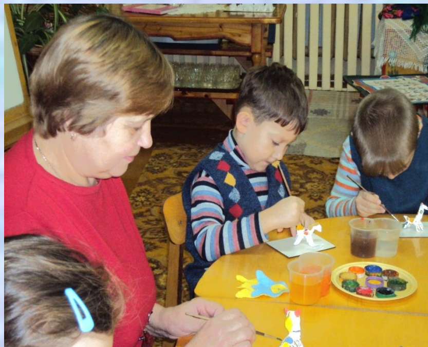
фото № 5

Подвести детей к мысли о похожести ряда стволов деревьев или их теней на полосы в узоре, клетчатого узора с кружками на паутину с капельками росы, кольца на спил дерева, голубая волнистая линия на ручеёк, зелёная на луг, и т. д. Дети соотносят фотографию и элемент узора на доске по очереди. Теперь знаете откуда дымковские мастера берут свои узоры? А оттого какие узоры увидел художник в природе, зависит и узор на его игрушке. Вот поэтому игрушки такие разные. А давайте вспомним, чему же нас учит природа?