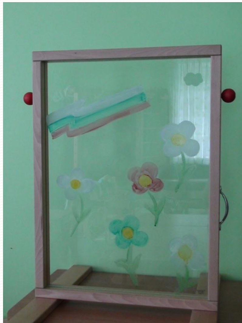
Стеклянный мольберт: работа гуашью