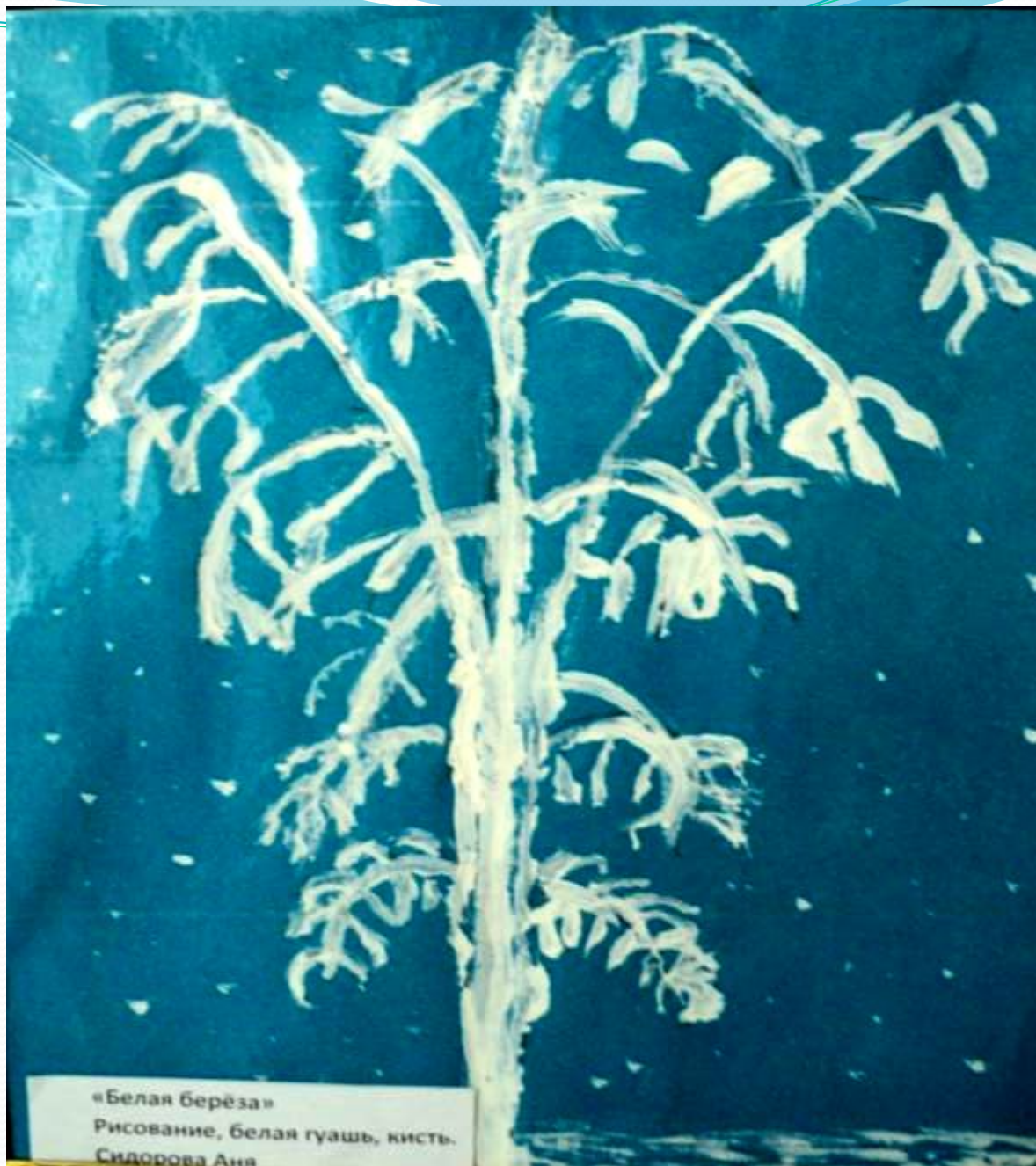
«Белая берёза» Рисование, белая гуашь, кисть. Сидорова Аня

Сидорова Аня, 5 лет, ДОУ №12 «Белая берёза». Рисование, гуашь.