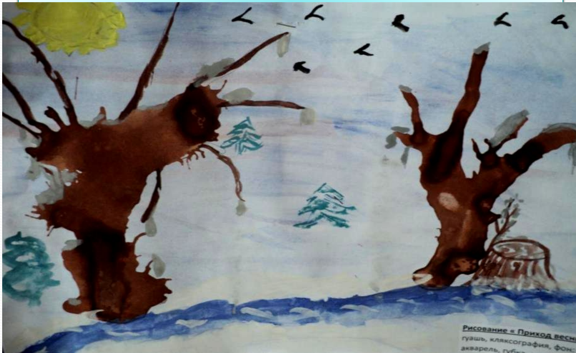
Рисование « Приход весны» гуашь, кляксография, фон: акварель, губка

Лупандин Илья, 5 лет, «Приход весны». Рисование, гуашь, кляксография, фон – акварель, «по-сырому», губка.