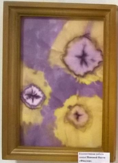
Коллективная работа худож. Шантай Насыа «Вальс» (Батик - роспись по ткани) 12 уроков