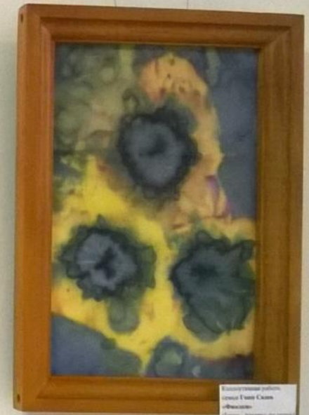
Коллективная работа худож. Улана Салам «Вальс» (Батик - роспись по ткани) 12 уроков