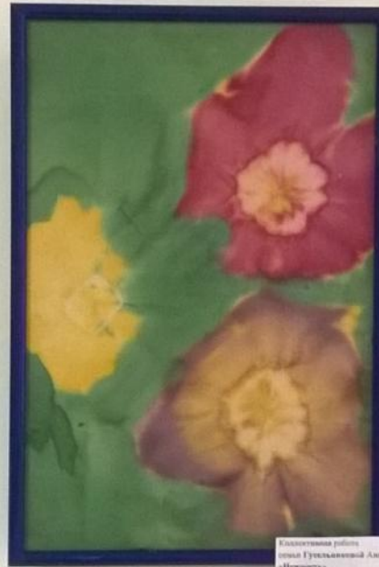
Коллективная работа худож. Гульшаймалык Аля «Вальс» (Батик - роспись по ткани)