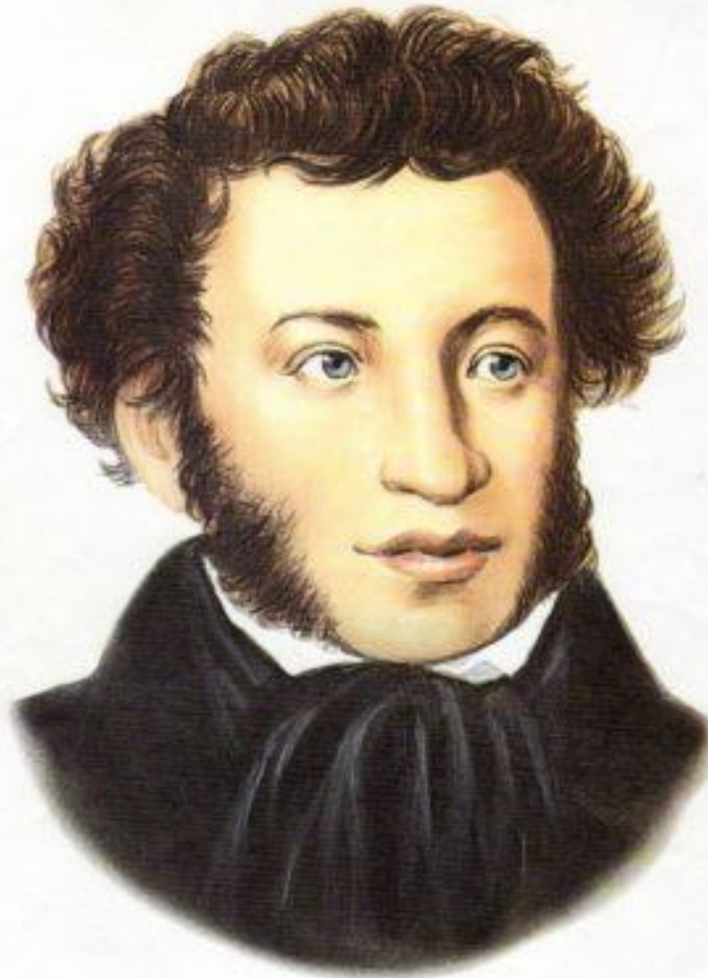
Пушкин Александр Сергеевич (1799-1837)