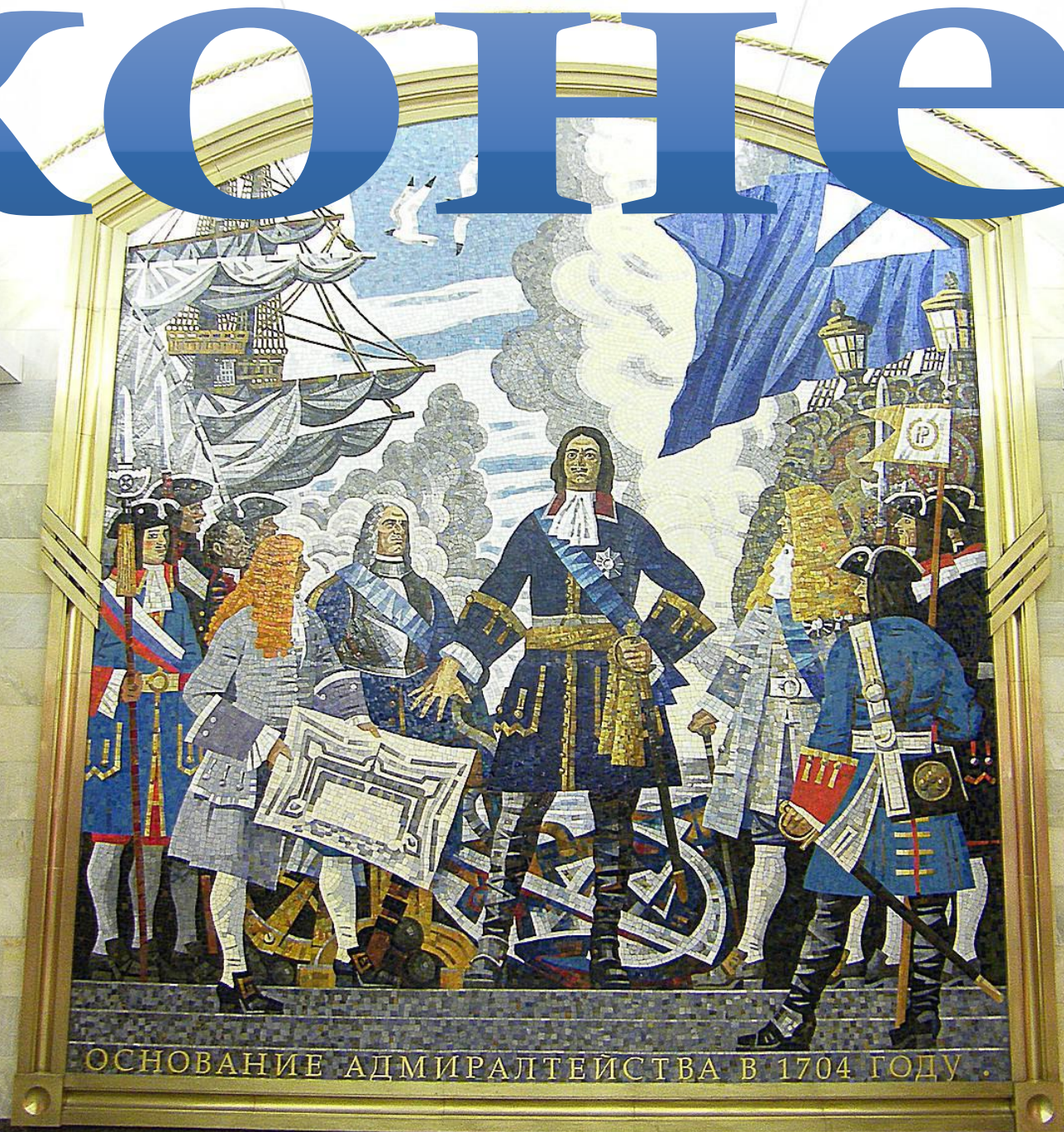
ОСНОВАНИЕ АДМИРАЛТЕЙСТВА В 1704 ГОДУ.