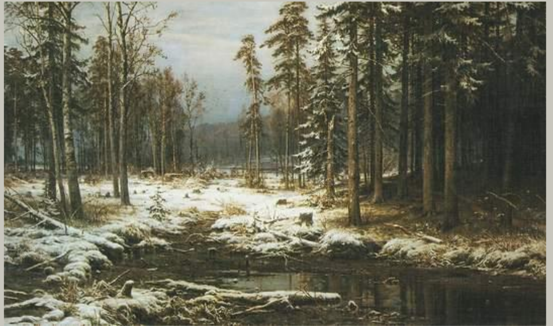
Первый снег. 1875 ШИШКИН

Французское слово «пейзаж» означает «природа». Она становится как бы «героем» произведения