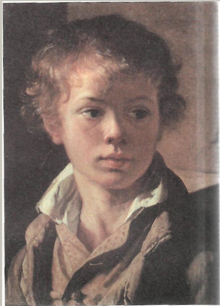
В. Тропинин. Портрет Арсения — сына художника