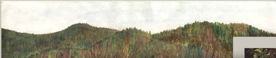
Шишкин Утро в сосновом лесу