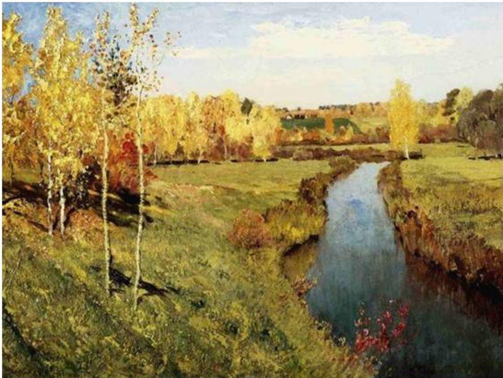
Картина И.И. Левитана «Золотая осень»