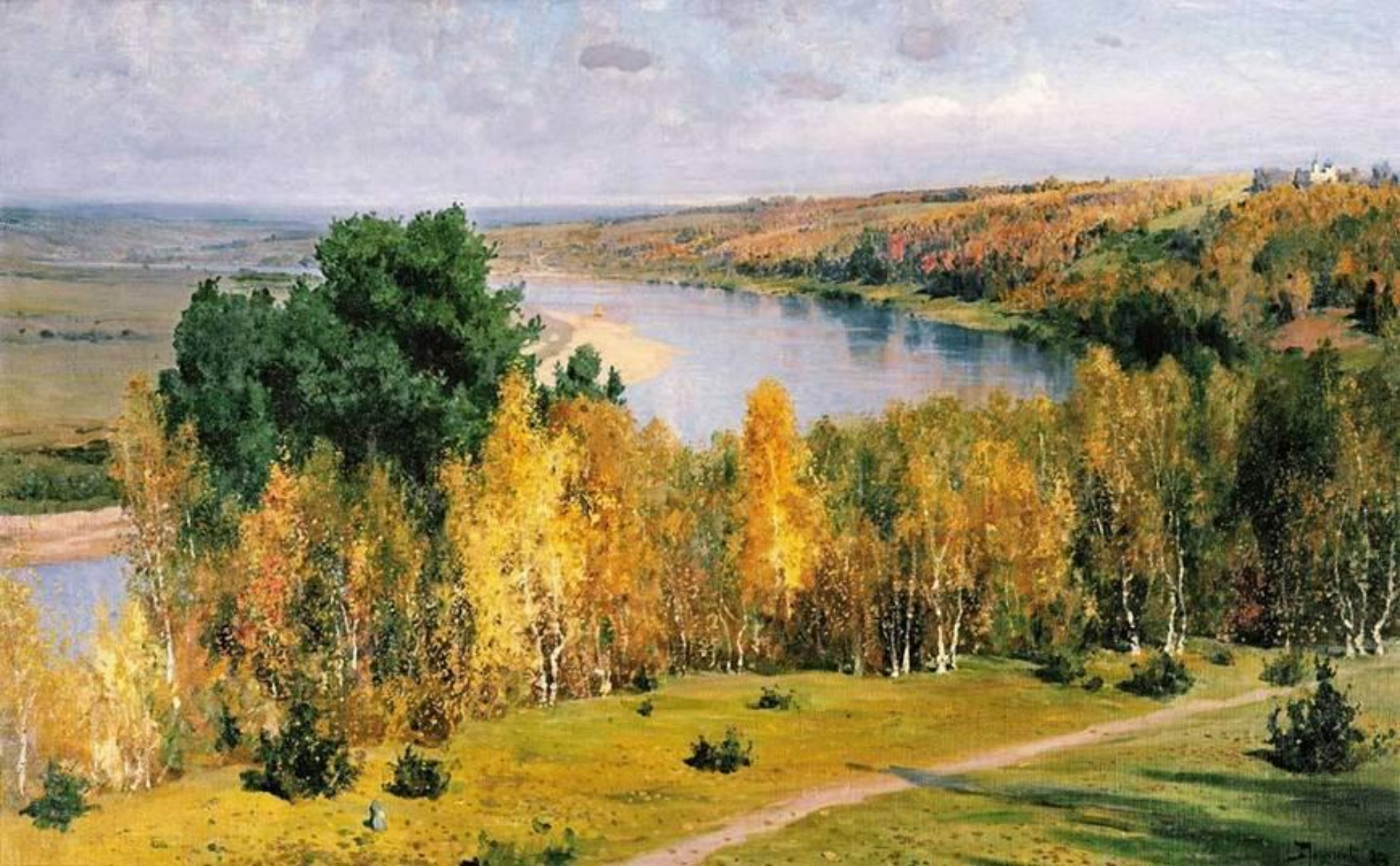
Поленов В.Д. «Золотая осень»