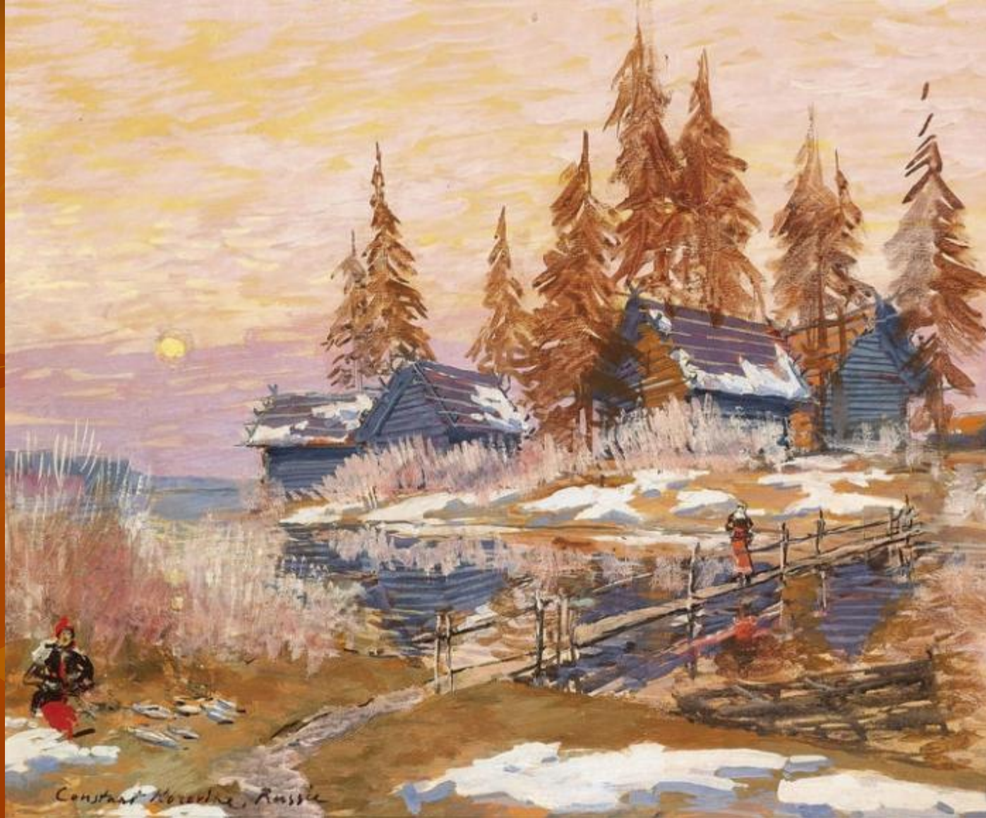
К. Коровин «Поздняя осень»