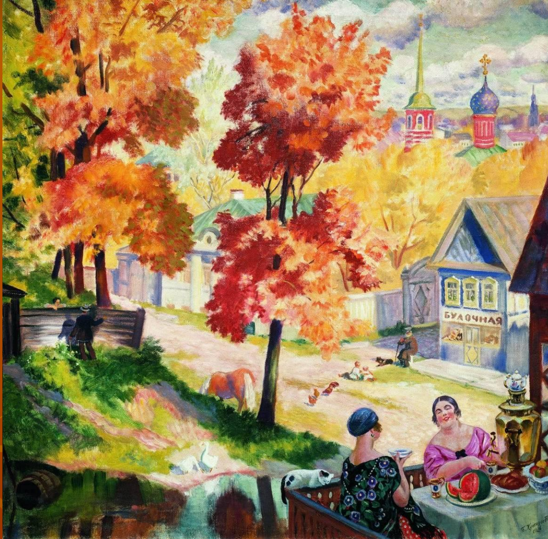
Б.Кустодиев «Осень в провинции. Чаепитие»