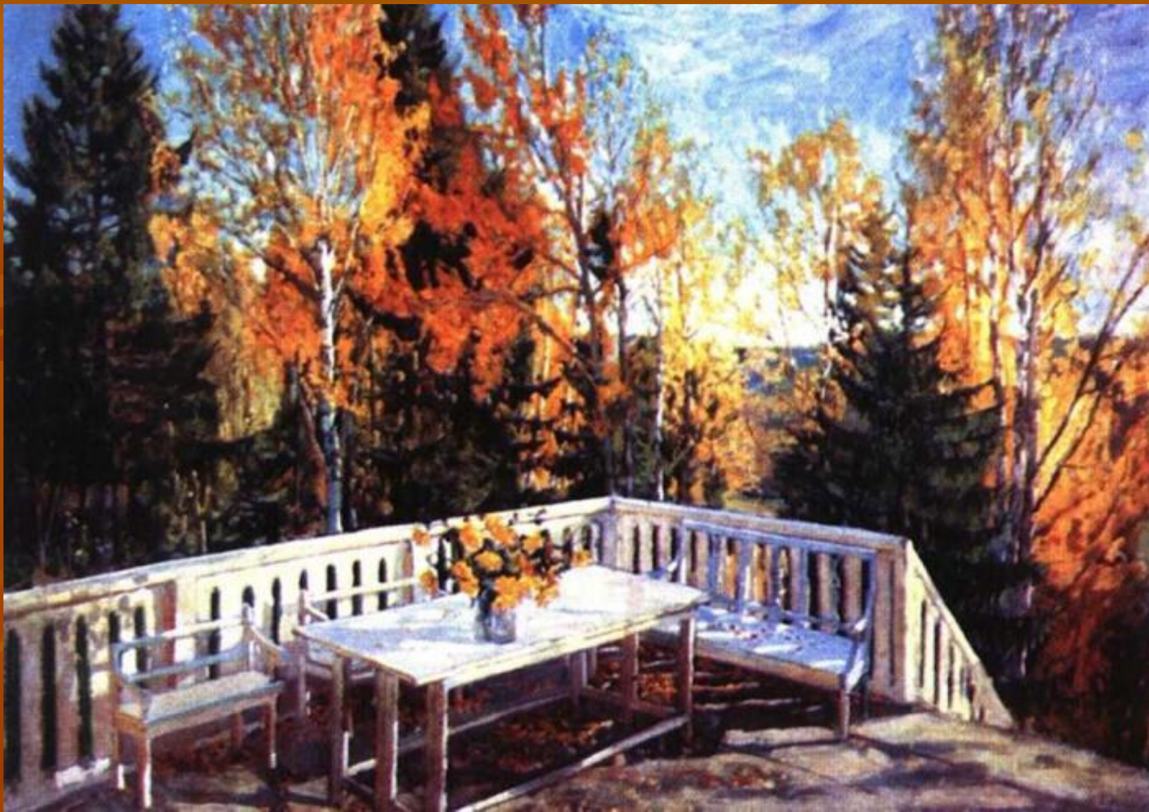
С.Жуковский «Осень. Веранда»