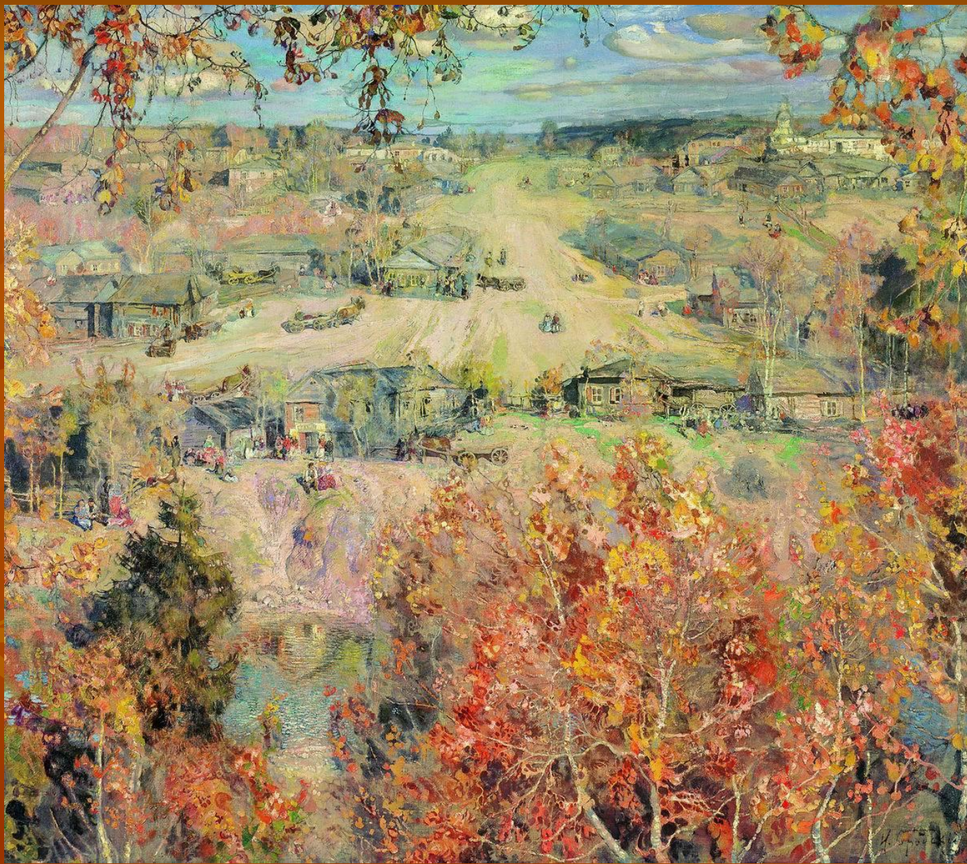
И. Бродский «Золотая осень»