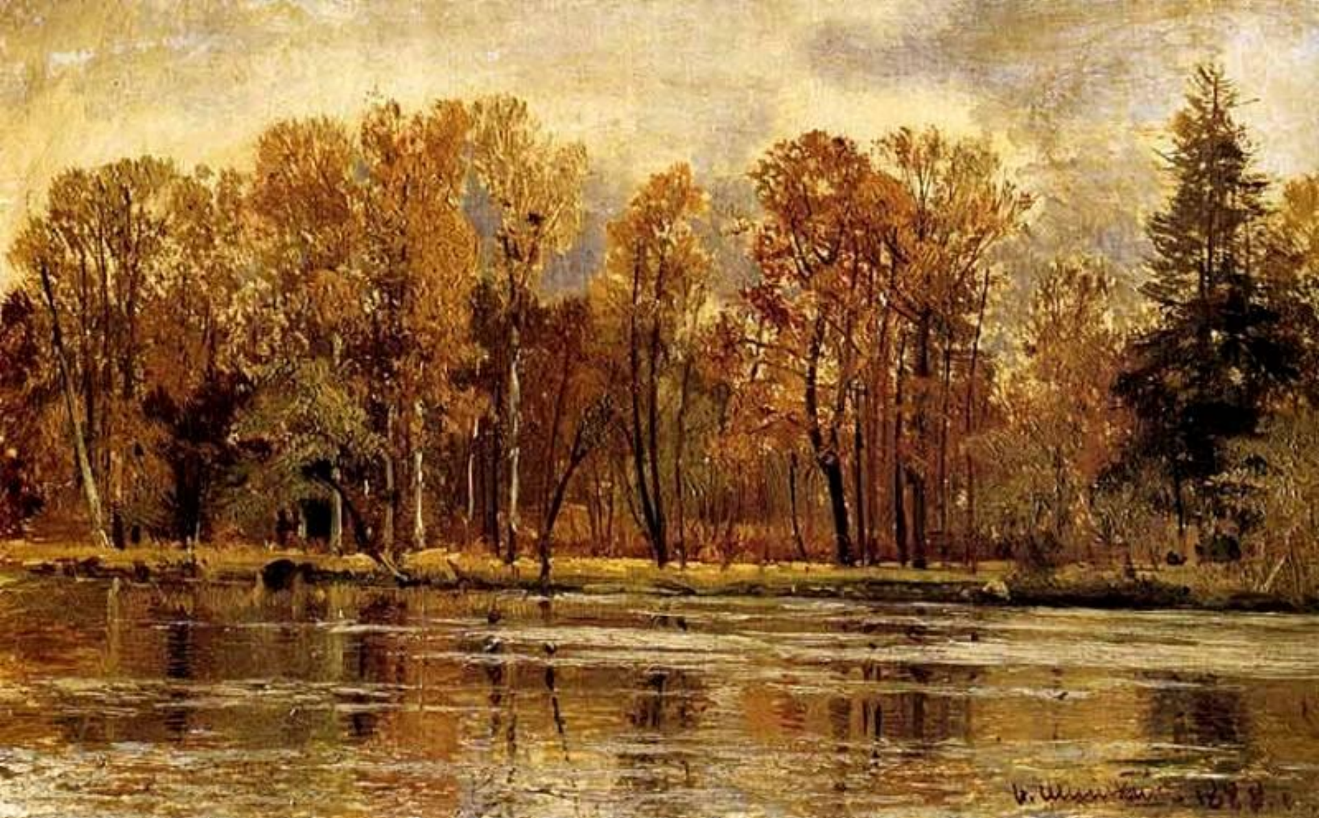
И.И.Шишкин «Золотая осень»