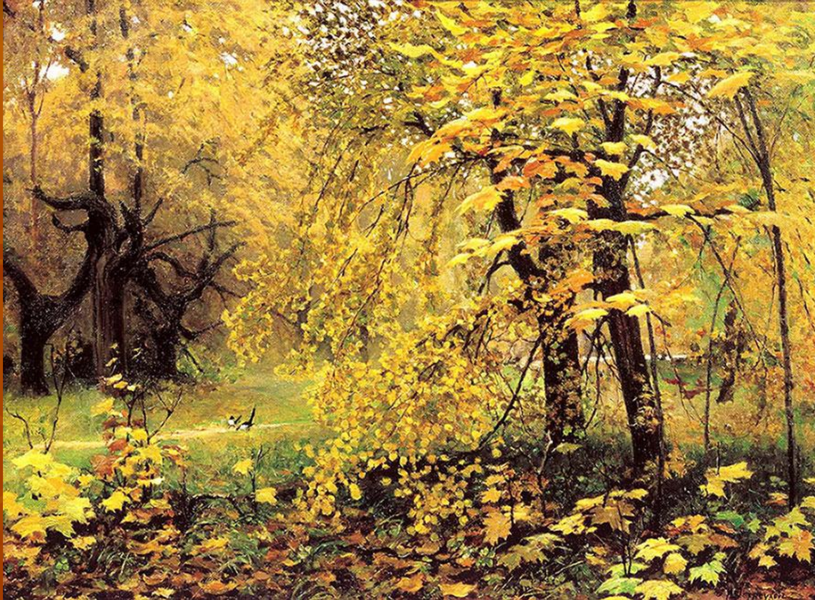
Остроухов И.С. «Золотая осень»