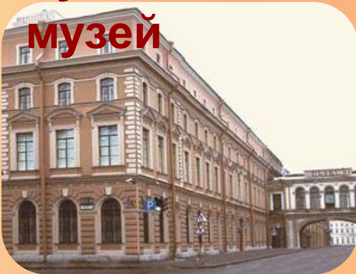
Музей религии и атеизма